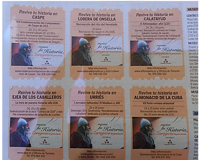
Ilustración 1. Captura del Heraldo de Aragón acerca de las recreaciones históricas que tienen lugar el fin de semana del 24 al 26 de junio de 2016.

Aun con todo ello, creemos que la iniciativa que se propone en estas páginas es novedosa en territorio aragonés, pues no hemos encontrado antecedentes idénticos a nuestra propuesta. Si bien sí tenemos constancia de otras iniciativas de similar naturaleza en ámbito nacional, como se trata de las realizadas en Toledo, 7 Gerona 8 , Madrid, 9 Vitoria 10 u Oviedo, 11 y en la esfera peninsular como es el caso de Almeida 12 , las que ven como un buen impulso turístico de difundir su Patrimonio Histórico y Artístico mediante este tipo de propuestas.