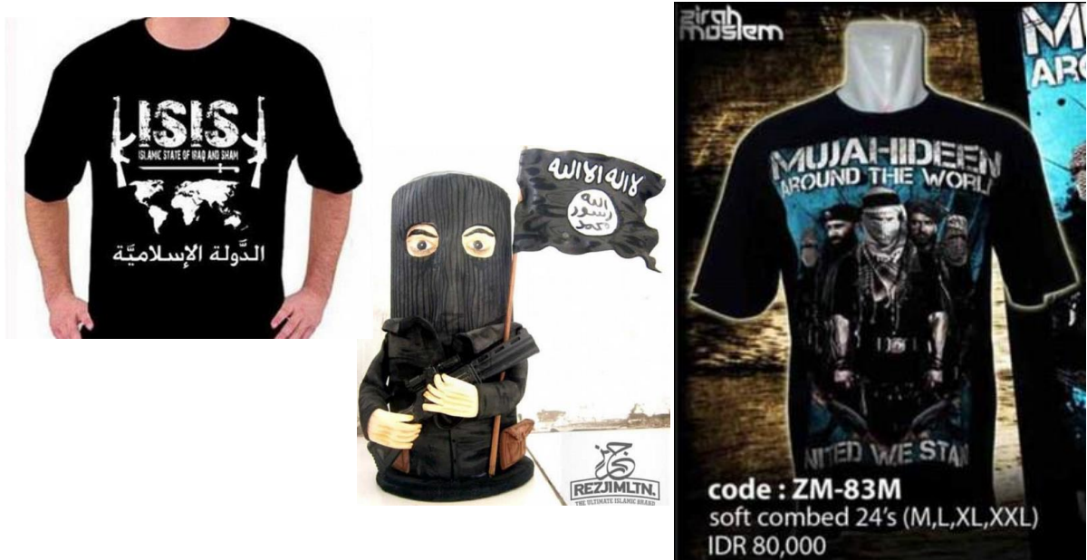
Ilustración 5, 6 y 7. Muestra del merchandising de Daesh.

Facebook constituye una de las principales herramientas de comunicación entre los miembros de la organización. Sin embargo, también se sirven de la misma para “monetizar su apoyo” mediante la venta online de merchandising (Barrancos, 2014:10).