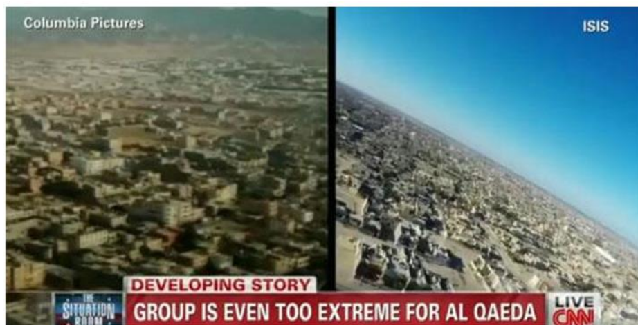
Ilustración 11. Comparación entre un producto de Columbia Pictures y Daesh.

Destaca la producción de vídeos altamente cuidados visualmente que tienden a parecerse a los productos audiovisuales de Hollywood 27 .