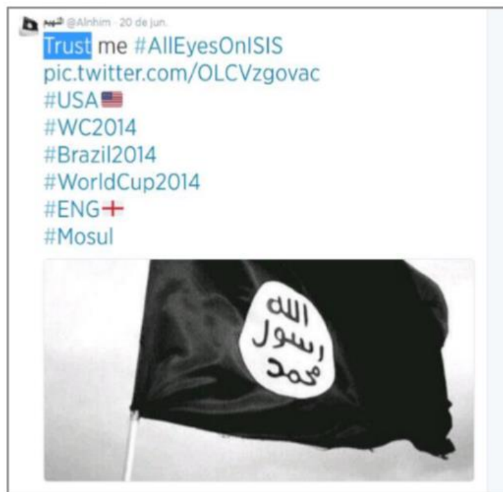
Ilustración 10. Ejemplos propagandísticos de Daesh en Twitter.

Por otro lado, Twitter sirve como transmisor de mensajes. La plataforma que permite un máximo de 140 caracteres es de gran utilidad gracias a la creación de hashtags que consiguen llegar a una gran parte de la población. La página web War on the rocks analizó el impacto de la campaña llevada a cabo el 20 de junio de 2014 con el hashtag #AllEyesOnISIS que contó con una gran participación por todo el mundo (Maher y Carter, 2014). Frente al bloqueo de cuentas en la red social, Daesh reaccionó utilizando los hashtags más populares del momento para transmitir imágenes relacionadas con la organización. De este modo, según relatan Mahear y Carter (2014) en su informe, se utilizó la Copa del Mundo de fútbol jugada en Brasil en 2014 para introducir mensajes propagandísticos de Daesh desde cuentas como @ainhim o @alwahsh1983 que ya han sido eliminadas. Sin embargo, Barrancos (2014:15) recuperó alguno de los tweets: