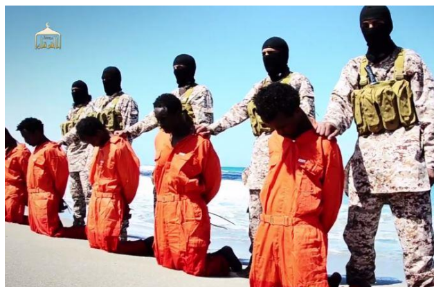
Ilustración 1. Comunicado de Daesh que castiga el cristianismo mediante la decapitación de 16 cristianos etíopes. El mensaje lo realiza una persona (“La sangre musulmana que fue derramada bajo las manos de vuestra religión, no es barata; de hecho, es la sangre más pura”) y a la vez se realiza la acción.

La comunicación de la organización terrorista se asemeja a la de un Estado. Daesh publica cada año un informe (al-Naba) en el que deja constancia de los atentados cometidos y establece sus objetivos en base a el terror causado. Su eficacia se ve potenciada por la estrategia mediática que utiliza el terror como para llevar al extremo su proyección exterior.