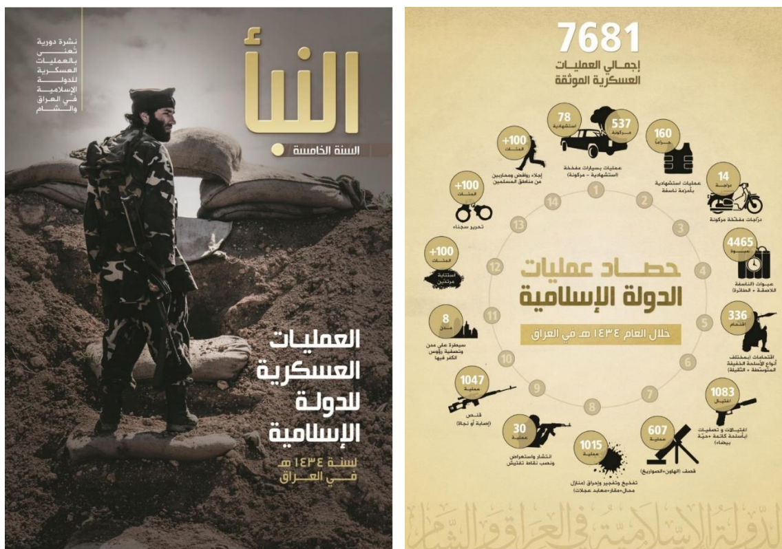
Ilustración 3 y 4. Portada del informe anual de ISIS y balance del terror del informe anual de 2013.

La propaganda estaría destinada tanto a mantener una ideología común entre la población local y captar adeptos fuera de las fronteras de Irak y Siria, como a causar impacto en la sociedad occidental, despertando conciencias en la misma (Jordán, 2015:139). Además del informe, también cuenta con una publicación propia, la revista Dabiq , como comunicación corporativa.