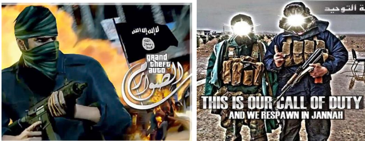
Ilustración 8 y 9. Ejemplos de la lucha por la yihad como un juego: Grand Theft Auto y Call of Duty.

Mientras tanto, Instagram es utilizado para mostrar imágenes de la vida cotidiana de los miembros y hacer así convincentes sus actos. Se llegan a comparar a los personajes de videojuegos, denominando a la yihad como “nuestro Call of Duty” o llevando su simbología a juegos como Grand Theft Auto.