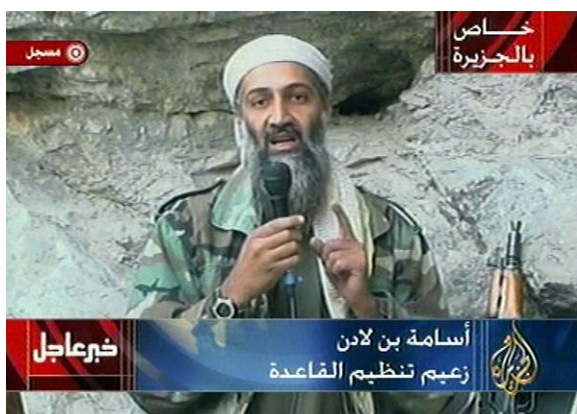
Ilustración 1. Comunicado en el que bin Laden advertía sobre atentados individuales en 2011.

Por otro lado, la difusión mediática es la que más popularidad está otorgando a la organización terrorista, y la que demuestra la radicalidad de la misma mediante vídeos que muestran torturas, matanzas y ataques terroristas. Los comunicados por parte de Daesh tienen una naturaleza que dista de los emitidos por Al Qaeda. No son “bustos parlantes” sino que ofrecen un enfoque más atractivo incluyendo testimonios que sugieren “podrías ser uno de nosotros” (Jordán, 2015:139).