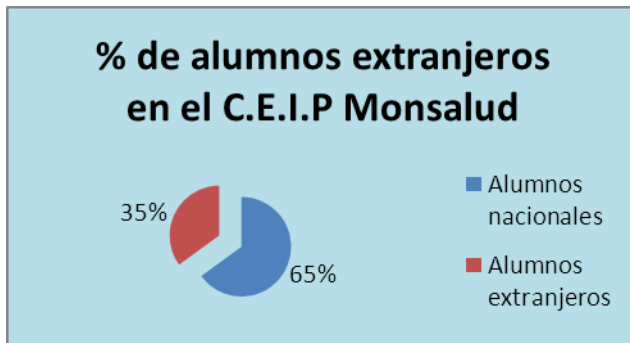
Gráfico 3. % de alumnos extranjeros en el C.E.I.P. Monsalud. Recogido en el apartado Documentos del Centro.