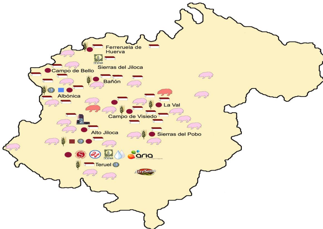
Cuadro 7: Mapa de las instalaciones.