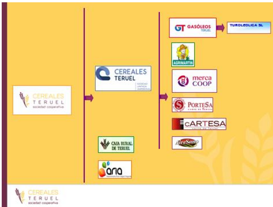
Cuadro 6: Organigrama empresarial.