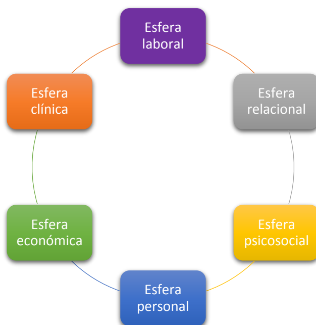
Ilustración 2. Esferas del paciente con DA

Para permitir una mejor organización de la lectura se presentan las referencias textuales de los pacientes entrevistados como notas al pie de página . Las abreviaturas utilizadas en las referencias textuales corresponden, en primer lugar, a los documentos primarios (DP) cuya id está representada por Atlas.ti con una “P” por lo que se ha mantenido la misma abreviatura que la id , seguida del número de documento; en segundo lugar, el número de párrafo del documento. De esta forma, viendo un ejemplo, “P2, 15” correspondería al documento primario 2 párrafo 15. Por otra parte, se ha adoptado el lenguaje masculino con fines prácticos.