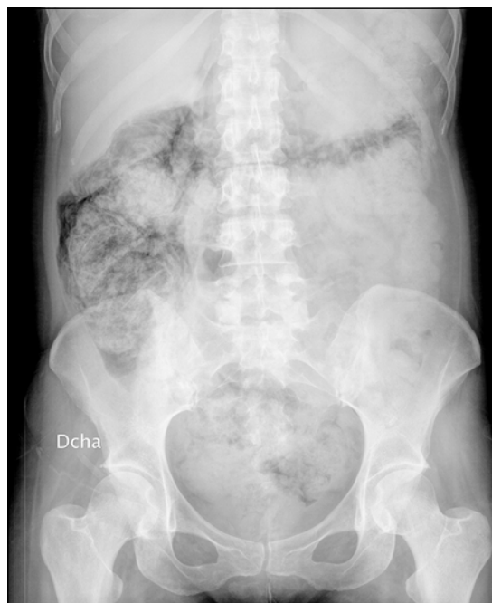
Figura 1. Radiología simple de abdomen.

Esta entidad se ha asociado con una enorme variedad de condiciones clínicas y se puede presentar en cualquier parte del tracto gastrointestinal; Tiene