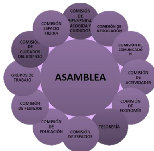
Ilustración 2. Organigrama CSC Luis Buñuel

“El Luis Buñuel será un espacio que impulse la participación directa de la ciudadanía en la gestión del dominio público. Un Centro Social que permita el desarrollo de las capacidades sociales y creativas de nuestra ciudadanía. Dichas capacidades comprenden tanto la acción educativa y social, como la producción cultural, el pensamiento crítico y la difusión de ideas, obras y procedimientos que permitan expandir y democratizar nuestra esfera pública”. (Colectivo Luis Buñuel, 2013, pág. 9)