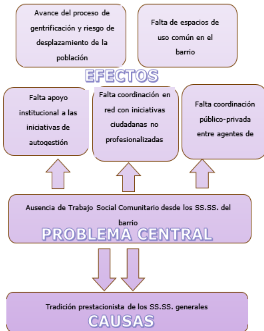
Ilustración 3. Árbol de problemas Proyecto de Intervención