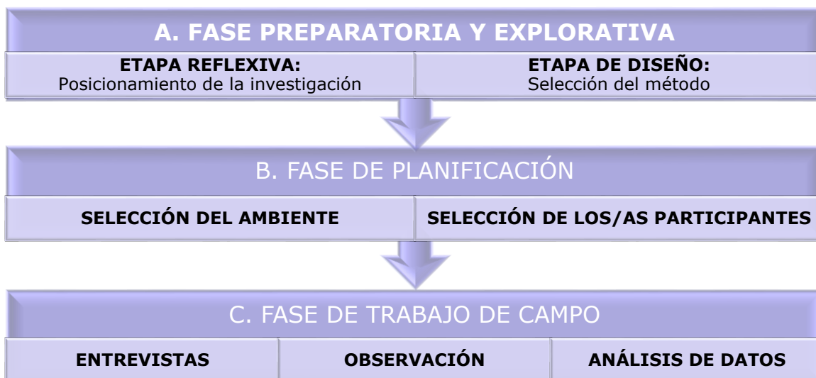
Tabla 1. Fases de la Investigación