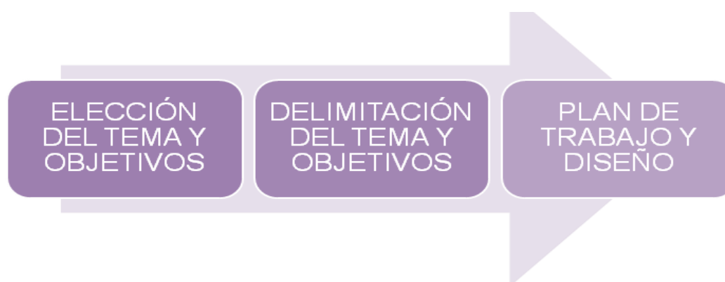
Ilustración 5. Diseño de la programación participativa

“Esta técnica no solo sirve para la planificación. También podemos utilizarla al inicio del proceso participativo, en la fase de diseño.” (CIMAS , 2009)