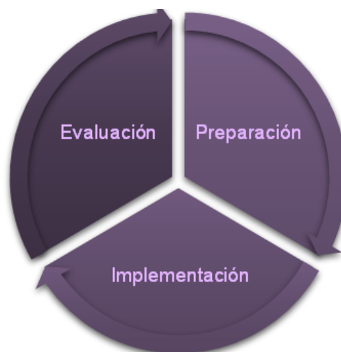
Ilustración 4. Fases del proyecto