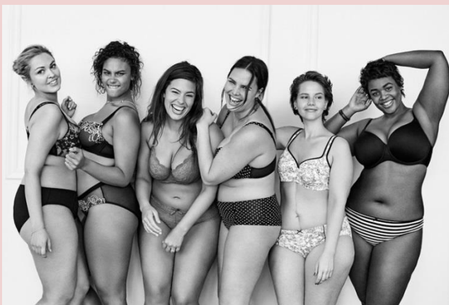
(El País, 2015)