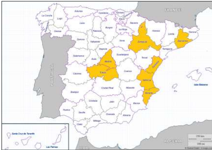
Mapa 1 (2007), provincias con mayor densidad de población rumana