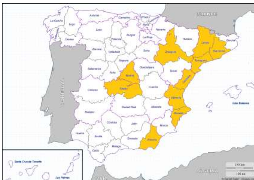
Mapa 2 (2015), provincias con mayor densidad de población rumana