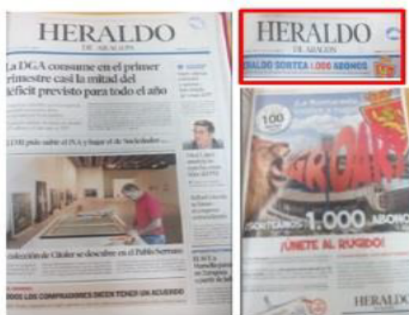
Imagen 1. Publicidad en portada

Aun así, el Real Zaragoza continuó progresando y acrecentando su imagen en la portada de Heraldo . Dejó de estar a la sombra para saltar a la palestra. A partir del 15 de julio, las portadas del medio no solo informaban con abundancia de los partidos y de la situación económica del equipo, sino que introdujeron las noticias de los “blanquillos” como si se tratase de un mensaje o elemento publicitario. Al principio, aparecía en la zona del faldón publicitario, pero luego estuvo conviviendo con la cabecera del medio. García Uceda lo denomina “publicidad promocional” porque se trata de acciones de difusión de la comunicación de la propia empresa, de su propia comunicación. Por tanto, lo que el público percibe es el producto más el “plus promocional” y, en la mayoría de ocasiones, se convierte en el verdadero motor de la decisión de compra de muchos lectores. Para evitar situaciones como la anterior, Joseph Pulitzer recomendaba a los diarios mantener una posición intermedia entre el comercialismo y el fracaso comercial. Debía de ser posible una conciliación entre el éxito comercial y las maneras responsables de ejercer la profesión. Unos meses antes de la compra del Real Zaragoza, esta situación era inconcebible. De hecho, la subdirectora del medio, Encarna Samitier, expuso en una conferencia en la Universidad San Jorge 11 que las noticias debían prevalecer por encima de los intereses económicos, e incluso si esas informaciones perjudicaban la imagen de la entidad.