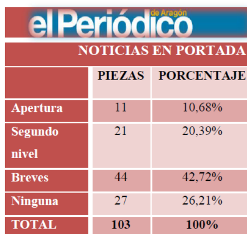
Tabla 3. Porcentaje de noticias en portada