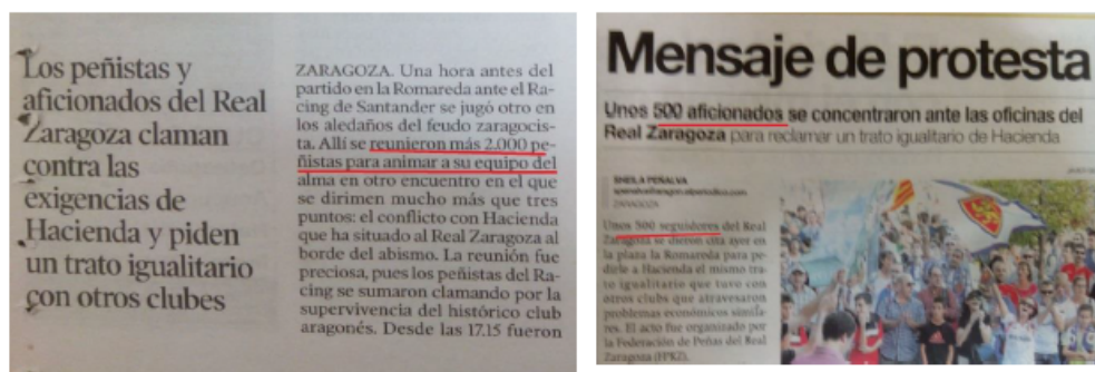
Imagen 2. Noticias del mismo día con datos enfrentados