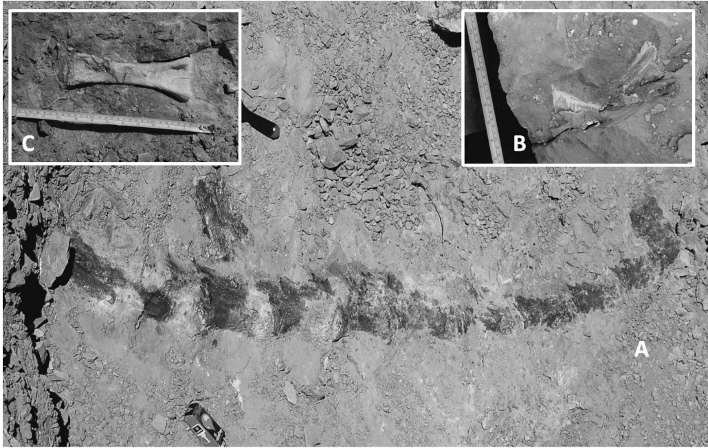
Figura 2. Aspecto de campo de algunos elementos anatómicos del saurópodo de Agrio del Medio. A) Vértebras caudales articuladas del ejemplar adulto. B) Mandíbula del ejemplar adulto. C) Ulna del ejemplar juvenil.

Inferior como Comahuesaurus , el cual presenta una diferente posición y desarrollo de la cresta deltopectoral. Además se encuentra bien separado de otros rebaquisáuridos africanos, europeos, y del Cretácico Superior de la Patagonia, como Limaysaurus , Cathertsaura . Se trata por tanto de un nuevo taxón de Rebbachisauridae y el primero de los taxones sudamericanos que conserva la región rostral del cráneo.