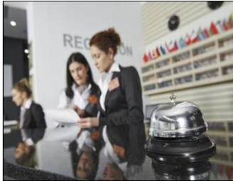
Tabla 2. Proyecto de innovación