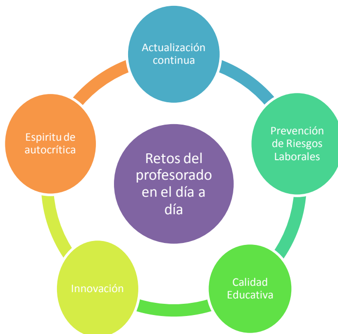
Figura 2: Retos del profesorado en el día a día.

Para cerrar esta introducción ilustro en la Figura 2 los retos del profesorado en el día a día de su trabajo.