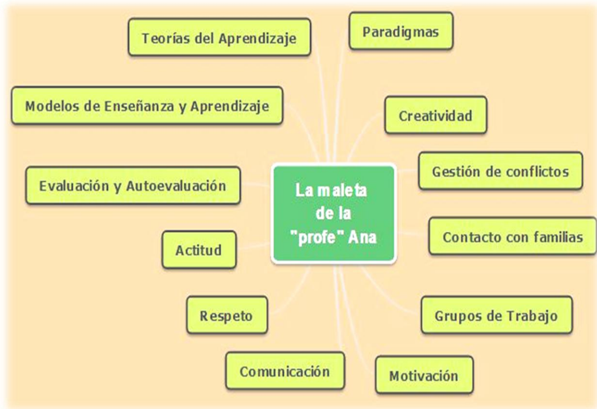
Figura 4: La maleta de la profesora Ana. (Fuente: Elaboración propia).