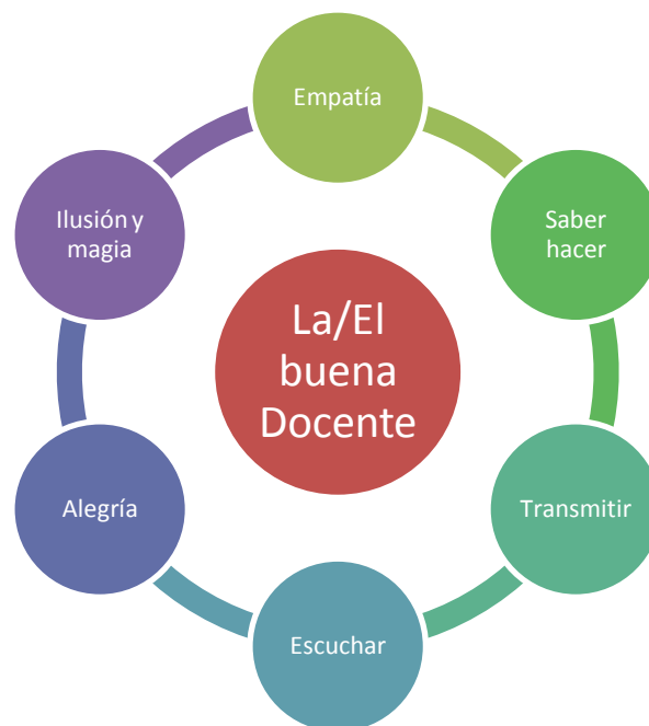
Figura 1: Ingredientes para ser una buena profesora.

En mi opinión, educar no es sólo transmitir unos conocimientos, sino que es enseñar a ser buenas personas (y buenos profesionales). En una de las presentaciones que realizamos al final de la asignatura de Fundamentos de Diseño Instruccional, un grupo presentó una dinámica en la que teníamos que construir de forma conjunta nuestra definición de la buena docente. En un tiempo muy reducido llegamos al consenso y lo plasmamos en una cartulina, utilizando materiales reciclados, construyendo los conceptos que se muestran en la figura 1.