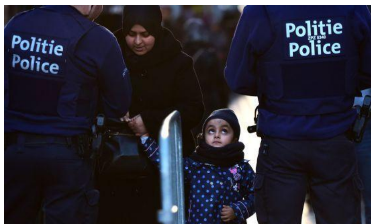
Noticia: La hora de la verdad en Europa.

Estas fotografías son la excepción puesto que en las demás noticias se intenta exaltar el papel de víctima o de madre sobreprotectora a través de fotografías como la siguiente: