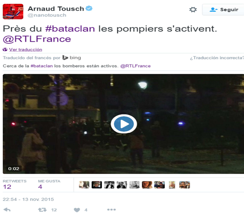
Ilustración 2- Tweet veraz de la cuenta del periodista Arnaud Tusch @nanotousch

redes sociales. Es posible identificar su identidad y además los tweets son coherentes y veraces.