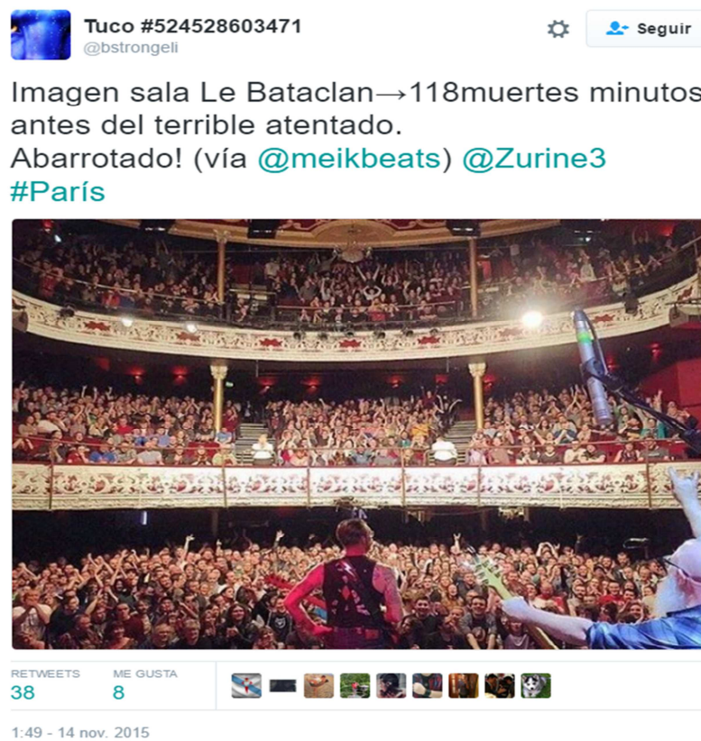
Ilustración 1- Tweet falso de la cuenta anónima @bstrongeli

El primer tweet analizado pertenece a la cuenta anónima @bstrongeli y es un ejemplo de publicación falsa en redes sociales. No es posible identificar su identidad y además los tweets carecen de coherencia y veracidad.