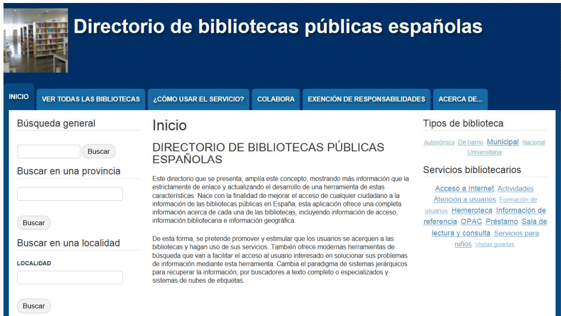
Ilustración 8. Pantalla principal del servicio