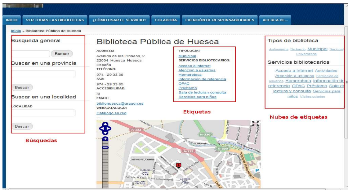
Ilustración 7. Situación de las búsquedas

Por último, hay que reseñar que el uso de etiquetas también permite relacionar búsquedas de acuerdo a un sistema de etiquetado desde dentro de las propias fichas de información. Para ello, bastará con pulsar sobre la etiqueta que se desee y el sistema devolverá una lista de bibliotecas que tengan en su información dicha etiqueta.