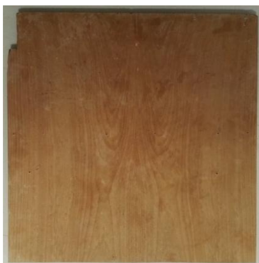
(a). Tabla 1

Se fabricó un aparato para evaluar las respuestas de los perros, consistente en dos tablas de madera de las mismas características y medidas, una de ellas con un recipiente cuadrado de plástico transparente ( tupperware ) atornillado en el centro y un agujero en la zona cubierta por este para introducir la comida. Sobre la otra tabla se colocó un recipiente idéntico al anterior sin fijación de ningún tipo (Figura 2).