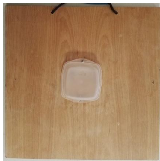
(b). Tabla 2