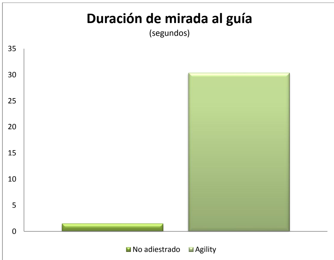
Gráfica 1. Duración de mirada al guía en segundos ( p < 0,001 ).

Las variables con resultados estadísticamente significativos están representadas a continuación en las gráfica 1 y 2.