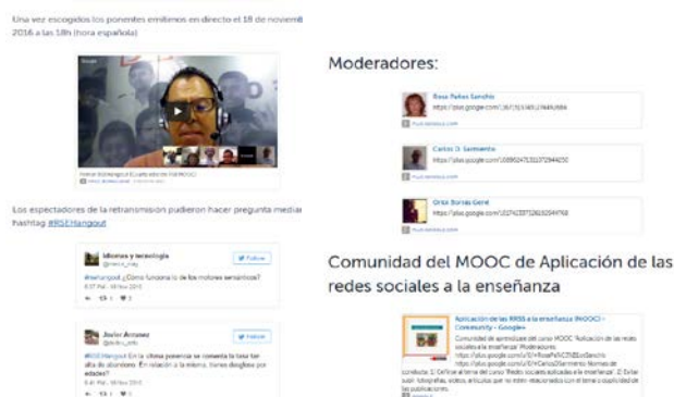
Figura 1. Línea de tiempo de Storify (Primer Hangout de la cuarta edición del MOOC de partida)

En la cuarta edición, tras completar la recopilación de ambos Hangouts, se creó un compilación o “Story” en la red social Storify (figura 1) para cada uno, en la que se incluyó contenido relacionado con cada Hangout: enlace al vídeo, información de los participantes, enlace a sus presentaciones, tuits más destacados, enlace al MOOC y la comunidad, etc.