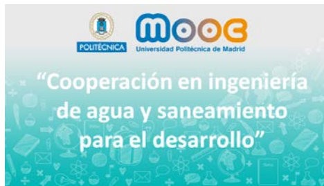
Figura 2: Maquetado inicial página inicio sobre plataforma de cursos abiertos (mooc).

que organiza el grupo, con lo cual se potenciará sus mutuas posibilidades de comunicación y formación.