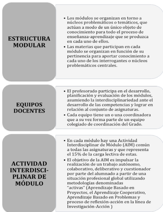
Figura 1. Novedades en la innovación curricular en el Grado de Educación Social.

El objetivo de este trabajo es definir el impacto que las innovaciones planteadas en el Grado de Educación Social de la E.U. de Magisterio de Bilbao están teniendo en la construcción de una nueva identidad y cultura docente que tiene como referencia la interdisciplinariedad y la colaboración tanto académica como con el mundo profesional.