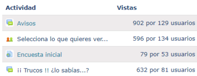
Figura 3: Fragmento del informe de Actividad del curso.

A partir de los informes Moodle de la “Actividad del curso”, se pueden ver en detalle los elementos que han tenido mayor número de accesos y la cantidad de usuarios diferentes que los han realizado (ver figura 3). Analizando esta información podemos ver que el foro de Avisos ha tenido la mayor cantidad