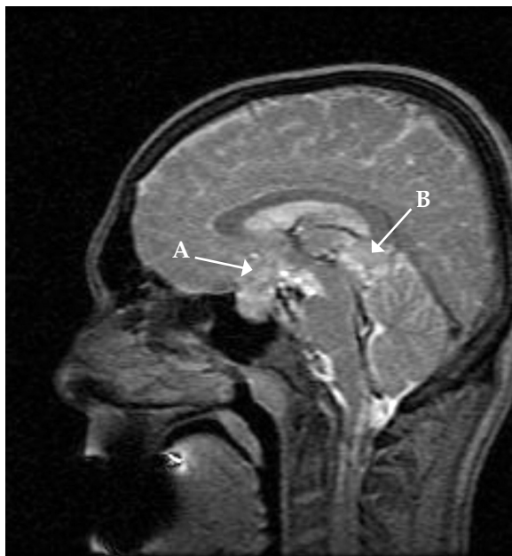
FIGURA 3. Resonancia magnética cerebral

A: lesión sellar de 21 x 31 x 36 mm. Engloba el quiasma óptico y desplaza anterior y lateralmente ambas carótidas, de calibre conservado. B: masa pineal de 26 x 19 x 17 mm de intensidad de señal heterogénea, con áreas quísticas y sólidas que realzan tras la administración de contraste y vacíos de señal puntiformes en relación con calcificaciones.