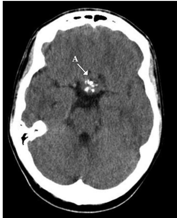
FIGURA 1. Tomografía computada cerebral

A: masa sellar que ocupa toda la región de la silla turca con extensión a la región paraselar derecha, que asocia calcificaciones distróficas en su seno