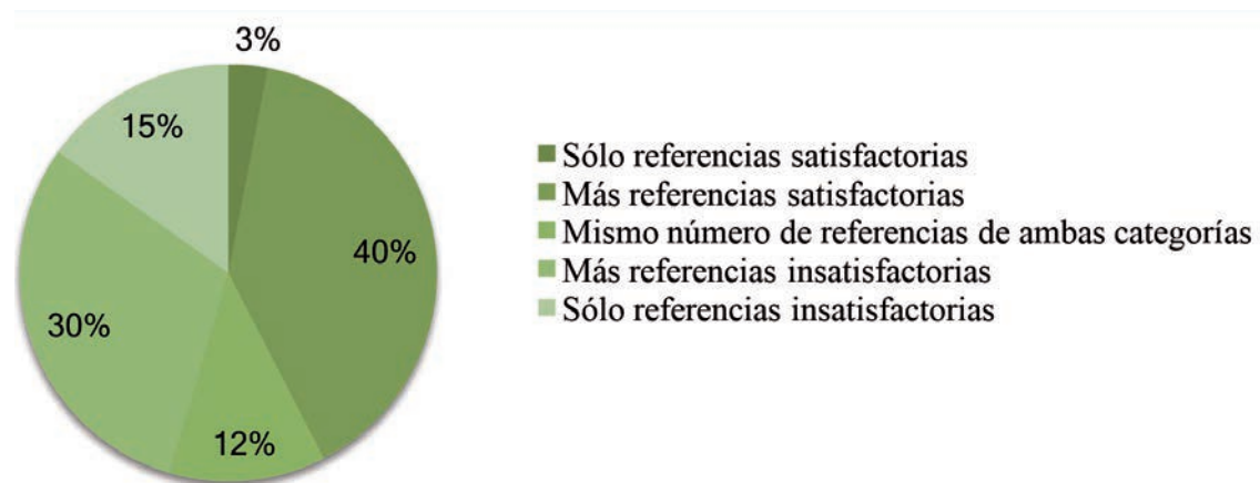
Figura 3 – Grado de satisfacción medido en función de su preferencia entre categorías.

La figura 3 refleja el grado de satisfacción según porcentaje de la muestra en función del número de referencias realizadas a las categorías de satisfacción e insatisfacción. Cabe destacar que tan sólo el 3% de la muestra recuerda todas sus experiencias con satisfacción, frente al 15% que lo recuerda todo de forma insatisfactoria. El 82% recuerda tanto experiencias positivas como negativas.