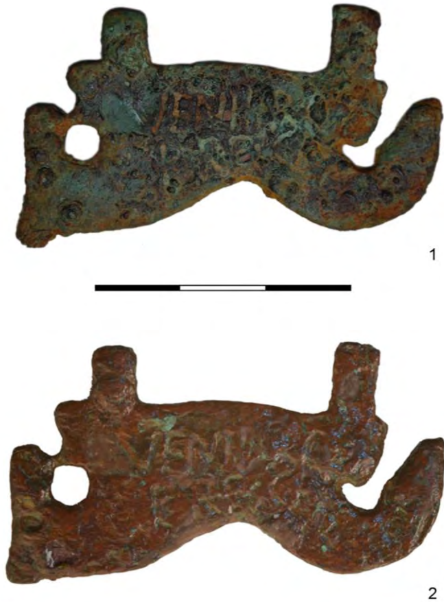
Fig. 6. Cara inscrita antes de la restauración (1) y después de ella (2) (Museo de Alfaro).

Nuestra lectura es (autopsias: 13.02.14; 19.05.14; 11.05.15; 21.09.16):