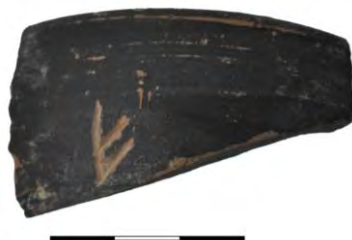
Fig. 13. Esgrafiado sobre fragmento de campaniense.

3. Esgrafiado post cocturam sobre fragmento de campaniense. Autopsia: 11.05.15. Museo de Alfaro (La Rioja). N° de reg. [ALF.1.89 - EE 5749]. Hallada en el yacimiento de Graccurreis , (Eras de S. Martín, Alfaro).