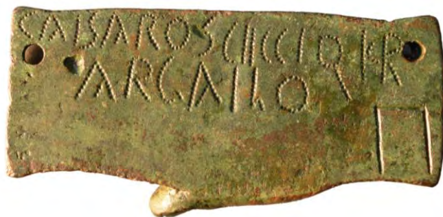
Fig. 7: Tésera de Paredes de Nava.

La segunda línea comienza con un signo que presenta un trazado particular. Está conformado por un trazo vertical que presenta en sus extremos dos pequeños refuerzos trazados hacia la derecha. A mitad de altura y en paralelo al astil vertical se aprecia una pequeña semicircunferencia, abierta también hacia la derecha, que no llega a tocarlo. Tras una detenida observación con lupa binocular, hemos comprobado que en esa zona central no se ven restos de que haya podido haber un trazo en paralelo a los otros dos refuerzos, lo que haría de esta grafía una E. En definitiva, pensamos que lo que aquí tenemos es una K al estilo de la tésera de Paredes de Navas [K.15.1] según la, a nuestro juicio, acertada propuesta de Curchin 1994. Existe una obvia diferencia paleo-epigráfica y es que en la pieza palentina la escritura se realiza mediante punción, de modo que la letra está conformada por una hasta de 12 punciones y una serie de siete punciones que conforman una pequeña media circunferencia abierta hacia el exterior, aquí, sin embargo, la técnica de escritura es la incisión.