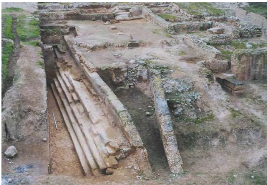
Fig. 3. Vista del conjunto durante la campaña de 1999, con el suelo de la piscina (UE 15723).

El desmontaje de los muros de las terrazas laterales provocó el deslizamiento de los rellenos superiores, que terminaron de colmatar la piscina con un estrato arenoso de más de un metro de grosor. Sobre estos rellenos, a partir del siglo VII d.C., se asienta un poblado que permanece en funcionamiento hasta los inicios del siglo IX, en los que el sitio pierde definitivamente su uso como lugar de habitación.