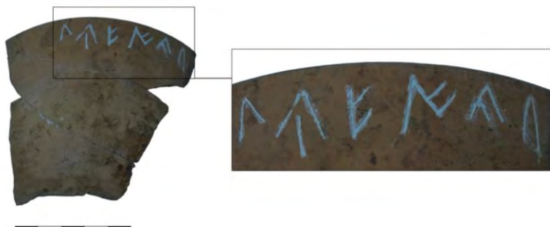
Fig. 11. Grafito sobre fragmento de taza de cerámica celtibérica.