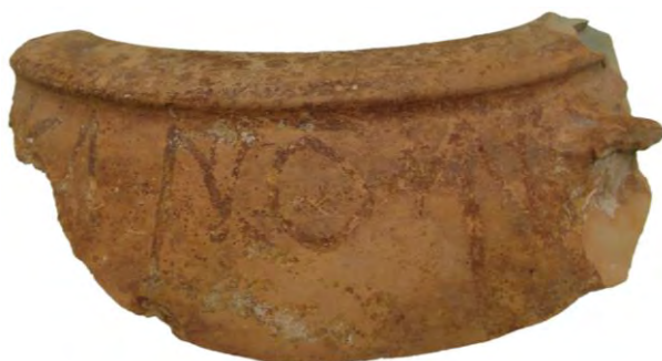
Fig. 12. Titulus pictus procedente de la Venta del Pillo. (Foto: J.A. Hernández).