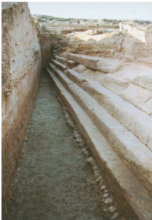
Fig. 4. Detalle del fondo de la piscina en el momento de documentar la UE 15724.

En el estrato inmediatamente superior, que como hemos señalado correspondía al suelo de la piscina y por lo tanto a un mismo momento constructivo, encontramos otro as de bronce (ALF.1.99.15723.68), con un peso de 10,04 g, y un diámetro 26,2 mm también correspondiente a Faustina la Menor.