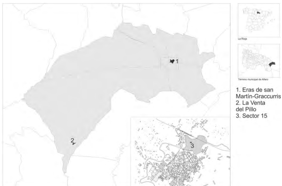
Fig. 1. Situación de los yacimientos citados en el término municipal de Alfaro y de Graccurris respecto al casco urbano.