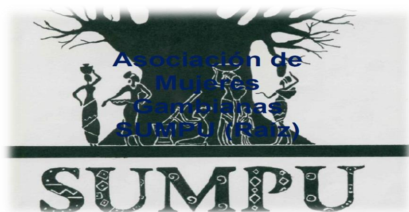
Ilustración 5. Logo de la asociación de mujeres gambiañas Sumpu

La asociación de mujeres gambiañas Sumpu es una asociación que a día de hoy cuenta con 56 mujeres de las cuales 19 son menores de 23 años. Dio sus inicios en el año 2012 aunque de manera informal. El objetivo principal de la creación de la asociación fue para ayudarse entre ellas ya que proceden del mismo ámbito local, el pueblo de Darsilameh . En sus inicios se reunían para hacer una actividad llamada “ tontine ”, es decir, una especie de colecta donde todas ponían una pequeña cantidad de dinero para ayudarse entre ellas y cubrir necesidades puntuales de algunas ellas.