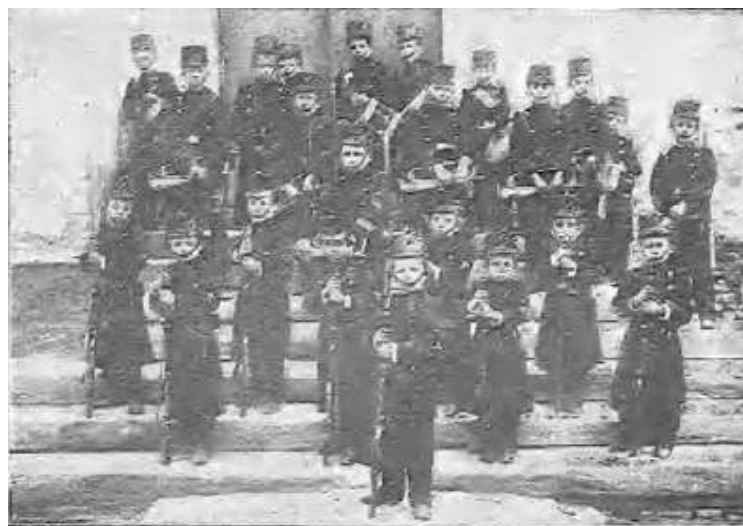
SOLDADOS Y BANDAS DE TROMPETAS Y TAMBORES DEL BATALLÓN

El Gráfico , Madrid, 21 de agosto de 1904. Fotografías de Enrique Capella.