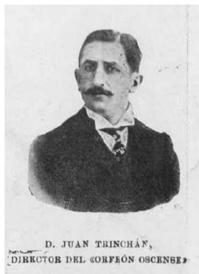
Revista Sol y Sombra nº 296, Madrid, 21 de Agosto de 1902.