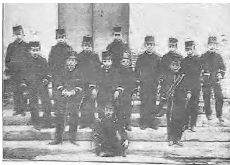
BATALLÓN INFANTIL DE MUESCA.—LOS JEFE Y OFICIALES

Las fotografías conservadas –aunque algunas con mala calidad- en el periódico madrileño El Gráfico , del 21 de agosto de 1904, realizadas por el músico y fotógrafo oscense Enrique Capella, retratan a algunos soldados del batallón. Junto a estos figuran la banda de tambores y trompetas, así como sus jefes y oficiales, posando con su uniforme de invierno, mucho más vistoso, que se encargaban en diciembre de 1903 gracias al dinero recaudado en la gran tómbola, a la que posteriormente nos referiremos: