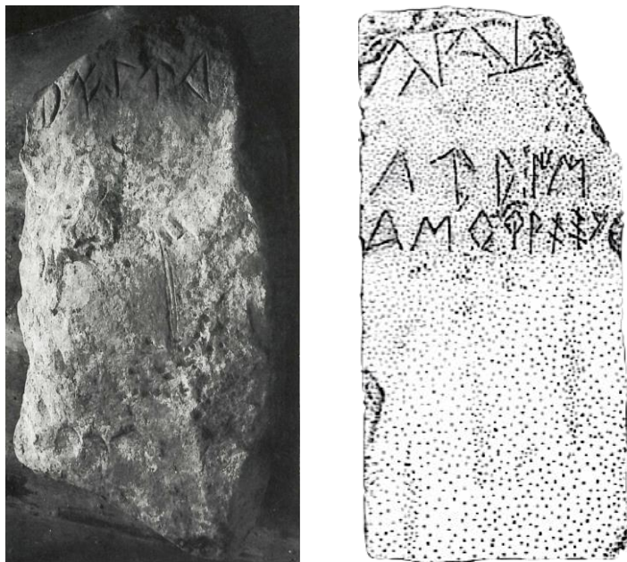
Figs. 1-2. Estelas ibéricas de Mengíbar (Arteaga y Blech 1994) y Cástulo (Cabrero 1994).

De Jaén provienen las dos estelas que se conservan con inscripciones ibéricas surorientales. La primera de ellas fue encontrada en la necrópolis de los Chorrillos, en Mengíbar (H.10.1). 11 La necrópolis, perteneciente al oppidum ibérico de Iliturgi , presenta unos materiales con una cronología que se prolonga desde el siglo V a.C. hasta mediados del I a.C., en tanto que la estela se data, de una manera amplia y sin demasiada seguridad, en época republicana. 12 La estela (fig. 1) presenta remate semicircular, reseñable puesto que como se ha señalado este tipo no está presente en la zona previamente a época romana. La corta inscripción, que se sitúa justo debajo del remate, no ha podido ser identificada con seguridad con la variante suroriental o nororiental del signario ibérico. Según Untermann, el quinto signo concuerda mejor con la forma más habitual del signo r nororiental, de manera que el cuarto signo habría que leerlo como una u , dejando la lectura ailur . Sin embargo, la situación geográfica y la variabilidad de las inscripciones meridionales hacen posible que la inscripción empleara el signario suroriental, resultando en una lectura ailbir . La primera opción tendría la ventaja de contar con un paralelo en ufkañailur , que figura en la lista de nombres del plomo de Enguera (F.21.1) y confirmaría que se trata de un antropónimo.