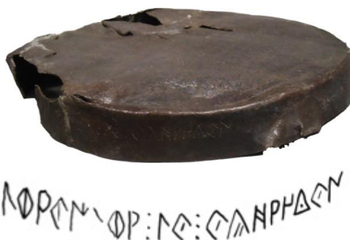
Fig. 5. Tapadera de la urna de Piquía y dibujo de la inscripción.

La otra estela proviene de la cercana Cástulo. 13 Se trata de una estela fragmentada, que ha perdido la parte superior por lo que se desconoce el tipo de remate (fig. 2). Aunque en este caso si se puede confirmar el uso de la variante suroriental, el mal estado de conservación de la pieza y la aparición de alógrafos no habituales hace que la lectura sea bastante insegura: ka++ / ibir ís / kaštiS46aos+ . 14 Llama la atención en primer lugar la ordinatio del texto, con una primera línea a modo de encabezamiento con tres signos, dejando un espacio antes de las dos líneas siguientes. La similitud visual con la estela latina U26 de Itálica, encabezada por la fórmula AVE , abre la posibilidad de que la pieza castulonense se sirviera de modelos itálico-romanos, si bien la falta de información lingüística del primer renglón lo convierte en una simple hipótesis. Respecto a la tercera línea (y siempre que se acepte la lectura) es interesante el paralelo con el topónimo kaštilo que aparece en las series con inscripción ibérica de las monedas castulonenses (A.97).