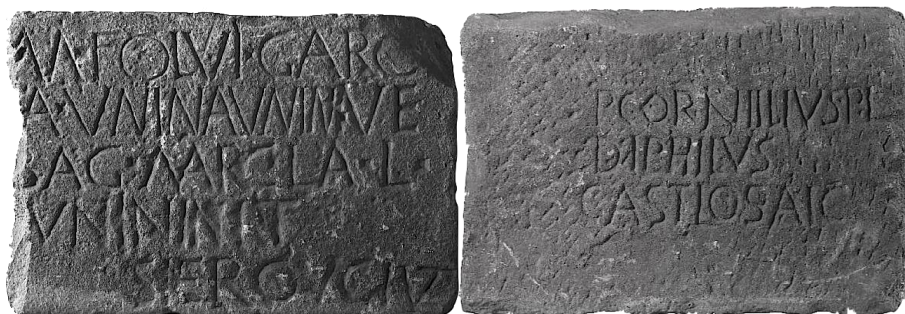
Figs. 3-4. Placa de Cástulo, caras a y b.