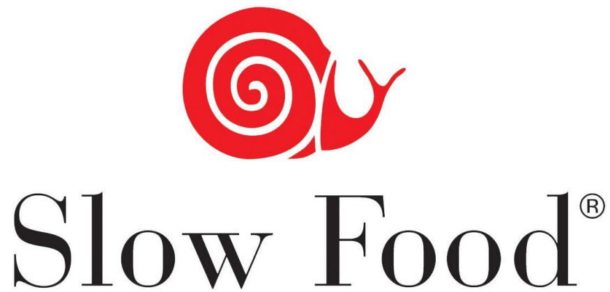
Figura 1. Comida lenta (Wallet, 2015, diap. 8)