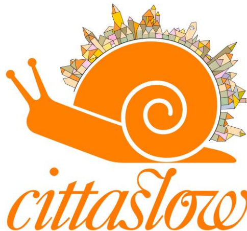
Figura 2. Ciudades Lentas (Wallet, 2015, diap. 19)