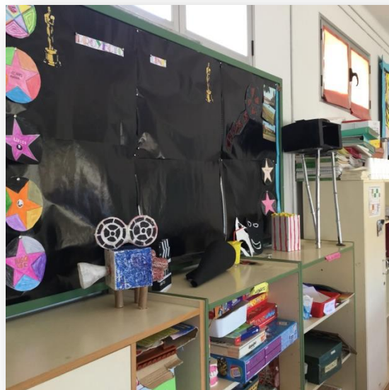
2- "Proyecto Cine". San Lorenzo del Flumen

Para poder explicar de una mejor forma el funcionamiento de los colegios rurales, los diferentes profesionales que aquí trabajan han colaborado conmigo dentro del documental para poder conseguir que la idea que yo buscaba fuera más fácil de entender.