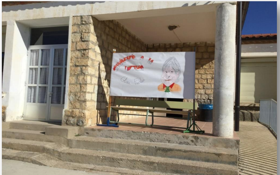
3- Dibujo Gloria Fuertes. Convivencia de la Literatura. San Lorenzo del Flumen

Este documental espera acercar a las personas que lo visionen a esa realidad.