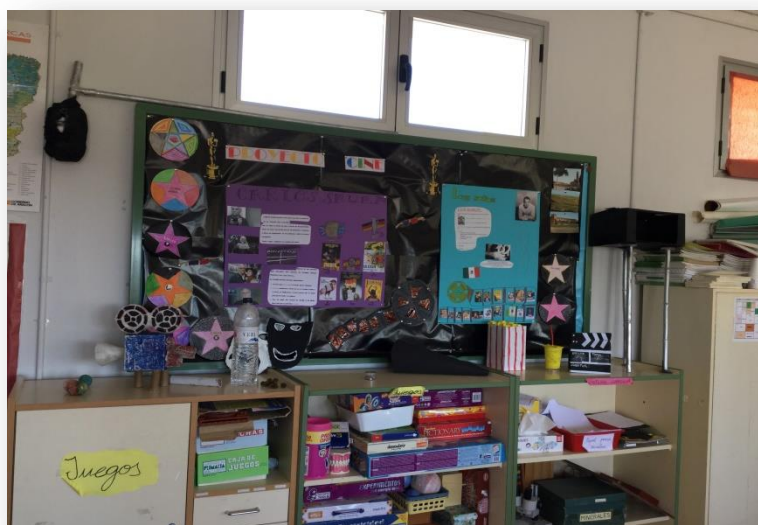
4- Mural del "Proyecto Cine" afrontado desde varias áreas

contaran a los alumnos de un centro convencional de una ciudad cómo se organizaban en esa aula. Esto también fue posible gracias a que algunos de los alumnos del colegio Santa Ana de Monzón, a los que les di clase en mi periodo de Prácticas de Educación Física, se ofrecieron voluntarios para grabarse y hacerles algunas preguntas a sus compañeros del colegio rural.