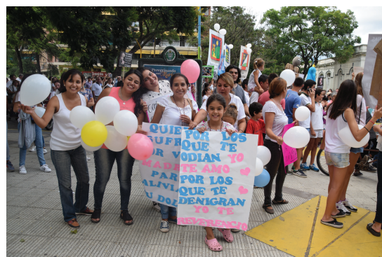
Ilustración 2: Asistentes a la peregrinación. Cartel: “Por los que te odian, yo te amo; por los que te denigran, yo te reverencio”. Elena Palacios

La marcha finalizó en la plaza Independencia, donde se instaló un escenario frente a la catedral y se llenó la plaza de sillas para asistir a los eventos de “desagravio a la virgen”. Cuando todos los grupos llegaron a la plaza comenzaron, casi simultáneamente, la misa del obispo y una fuerte tormenta. “Esta es una lluvia que dura un ratito, son las lágrimas de la Virgen emocionada”, se escuchó por el micrófono. Zecca habló a la Virgen pidiéndole “perdón” por las “injurias y agravios y toda clase de ultrajes contra ti y tu amado hijo Jesucristo”. Los asistentes, entre los que se incluían personajes públicos como el alcalde de San Miguel de Tucumán permanecieron en los actos a pesar de las fuertes lluvias (Anexo I, art. 57). El evento resultó masivo, acudieron más de 25.000 mil personas, según en diario La Gaceta (Anexo I, art. 56), llegaron incluso desde otras provincias.