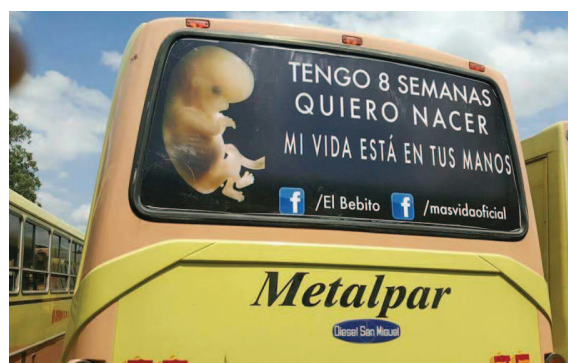
Ilustración 5: Campaña El Bebito, autobuses de Tucumán: “Tengo 8 semanas, quiero nacer. Mi vida está en tus manos”. Publicada en: http://masvidaoficial.org/galeria-de-fotos/

Sumándose a estas movilizaciones, el grupo Católico Tucumán Pro Vida convocaba otra marcha el lunes 27 de marzo en el Instituto de Maternidad de Tucumán. Según su comunicado "en defensa de la vida humana, desde la concepción hasta la muerte natural" y contra el "lobby abortista" (Anexo I, art. 50).