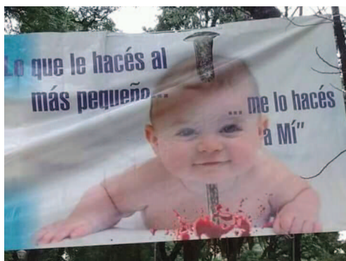
Ilustración 4: Cartel colgado en la plaza Urquiza: “Lo que le hacés al más pequeño... me lo hacés a mí”.