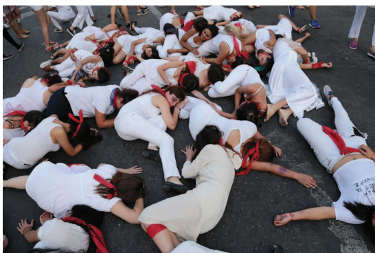
Ilustración 6: Performance Trescientas . Mujeres desvanecidas frente a la catedral.

formando una montaña de mujeres desvanecidas, alrededor de la cual se extendían dos círculos de mujeres mirando hacia fuera en alerta. Después se levantaron y caminaron, de nuevo en silencio y mirando hacia el frente, hasta la Casa de Gobierno, donde de nuevo cayeron al suelo, esta vez dispersas. Las compañeras dibujaron en torno a ellas sus siluetas, que quedaron pintadas en el suelo con aerosol. Mientras estaban tendidas en el suelo el silencio lo rompía un tambor que acompañaba la performance, los disparos de algunas cámaras y el vuelo de un dron. Todo estaba organizado para difundir después las imágenes. Cuando se levantaron se quitaron las mordazas y las extendieron al aire. Finalmente se unieron en un círculo en torno a la Estatua de la Libertad de Tucumán 14 donde lanzaron las mordazas rojas al suelo y se abrazaron entre gestos de júbilo.