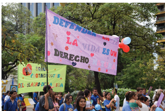
Ilustración 3: Estrazas con frases pro vida: “Defender la vida es un derecho natural”, “Somos testigos del milagro de la vida”. Elena Palacios

completas, sacerdotes, profesionales y movimientos laicales, además la Legislatura de Tucumán había declarado la peregrinación de interés provincial. La marcha transcurrió entre cientos de pancartas con mensajes antiabortistas, estrazas, crucifijos, globos, instrumentos musicales, imágenes de Jesús, banderas de órdenes religiosas, banderas argentinas, caballos y vehículos con figuras católicas encima. En cada cruce de calles colgaban pancartas que mostraban en orden los meses del embarazo y la evolución del feto, con alusiones a Dios y Jesús, como por ejemplo: “Mes 8. Estoy preparado para salir. Mi alma tiene sed de ti Señor”. A lo largo de toda la calle habían instalados megáfonos a través de los cuales sonaban canciones religiosas y versículos de la Biblia. La gente, que caminaba entre cánticos religiosos y gritos de “sí a la vida”, parecía haberse puesto de acuerdo para vestir de blanco. Muchos grupos iban ataviados a conjunto con lo que parecían disfraces y trajes tradicionales.