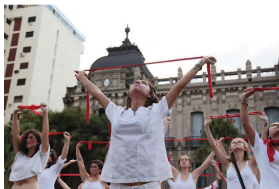
Ilustración 7: Performance Trescientas . Mujeres quitándose la mordaza.

La performance trataba de llamar la atención desde el impacto visual, para concienciar sobre el aborto y la violencia de género. Tras la intervención se emitió un comunicado oficial que se mandó a muchos medios de Tucumán, sobre todo a los independientes (Anexo I, art. 42-45). Expresaba: “ Trescientas fue una Performance y Campaña Fotográfica de masiva convocatoria sin precedentes en Contra de la Violencia Hacia las Mujeres, en Defensa de la Libertad de Expresión y en Solidaridad con las compañeras de Socorro Rosa Tucumán, que fue sostenida colectivamente por Artistas de diversas disciplinas, Estudiantes, Espacios Culturales y Medios de Comunicación Independiente”