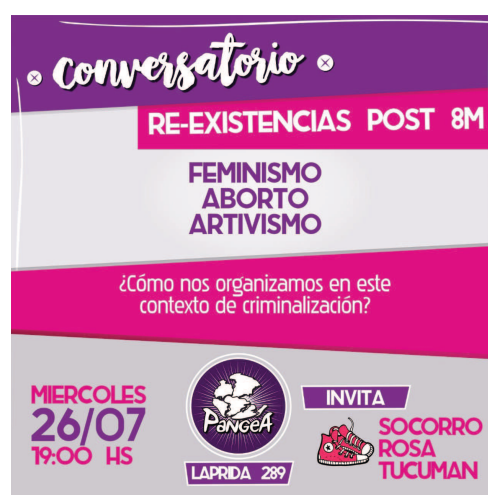
Ilustración 8: Flyer del conversatorio Re-existencias post 8M . Difusión privada.

El día 22 de noviembre el Inadi emite un dictamen sobre la performance. Tras ocho meses desde la recepción de las 77.000 firmas, este organismo del Estado defiende que