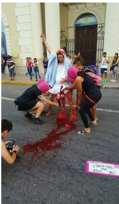
Ilustración 1: Imágen de la performance publicada en los medios de comunicación. Sin fuente. Extraída de Clarín .

En San Miguel de Tucumán se calcula que la convocatoria de las marchas y eventos atrajo, según el colectivo Ni Una Menos, en torno a 15.000 personas, llenó mas de 5 cuadras a lo largo de la calle 25 de marzo, una de las calles principales de Tucumán. La marcha comenzó a las 18 horas y el recorrido se realizó desde la Plaza Urquiza hasta la Plaza Independencia, la más céntrica e importante de la ciudad.