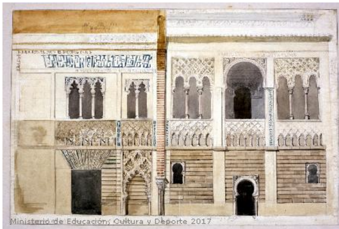
Fig.19: Proyecto de restauración de la fachada del Alcázar de Sevilla. Museo Lázaro Galdiano. 1820[ca]-1880[ca]