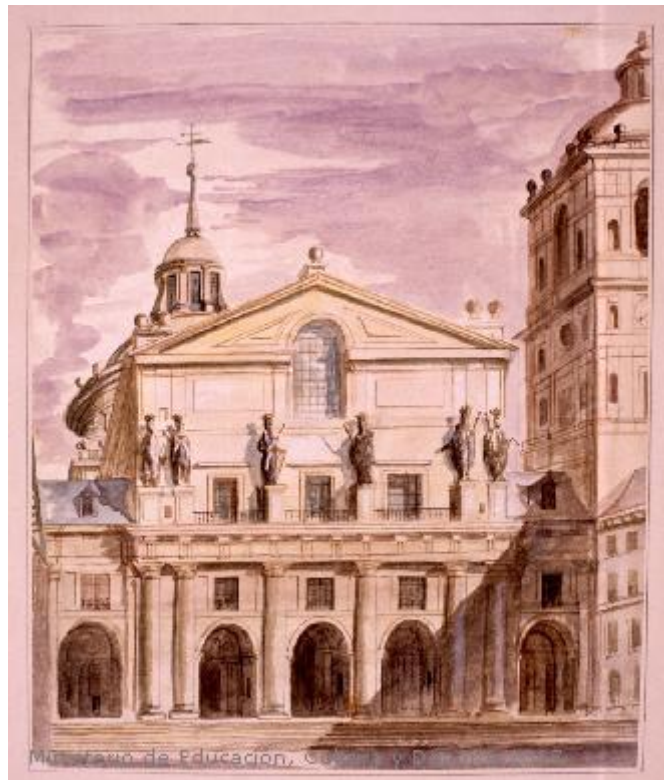
Fig.9: Patio de los Reyes, San Lorenzo de El Escorial, Madrid. Museo Lázaro Galdiano. 1820[ca]-1880[ca]