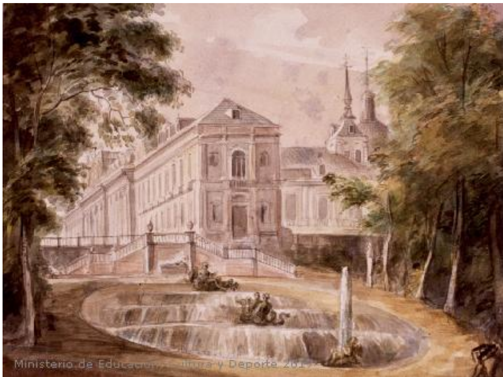
Fig.10: Vista del palacio de La Granja desde la fuente de la Selva, Segovia. Museo Lázaro Galdiano 1850[ca]