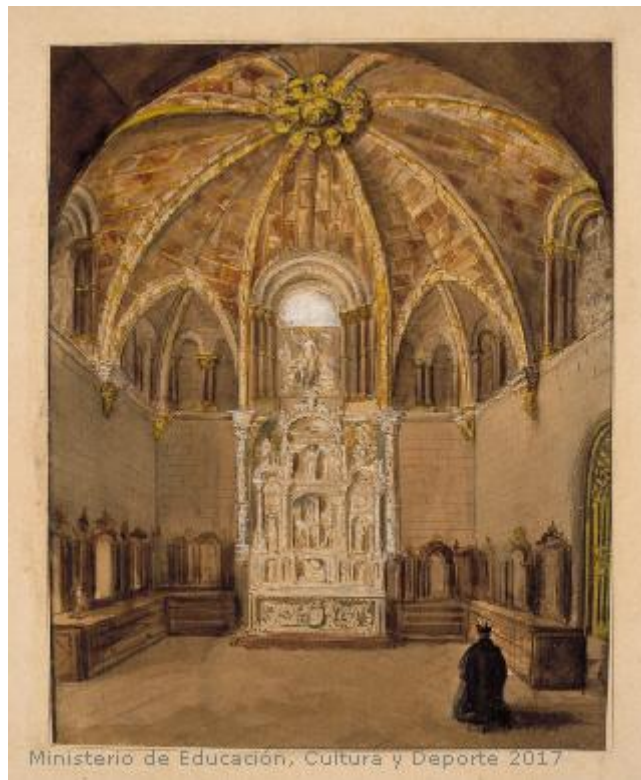
Fig.13: Vista de la Sacristía de la catedral de Avila. Museo Lázaro Galdiano. 1850.