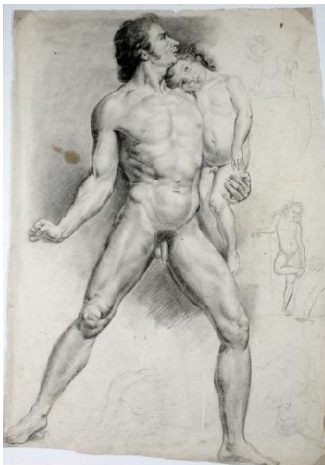
Fig.1: Desnudo masculino . Museo de Huesca. 1822-1831