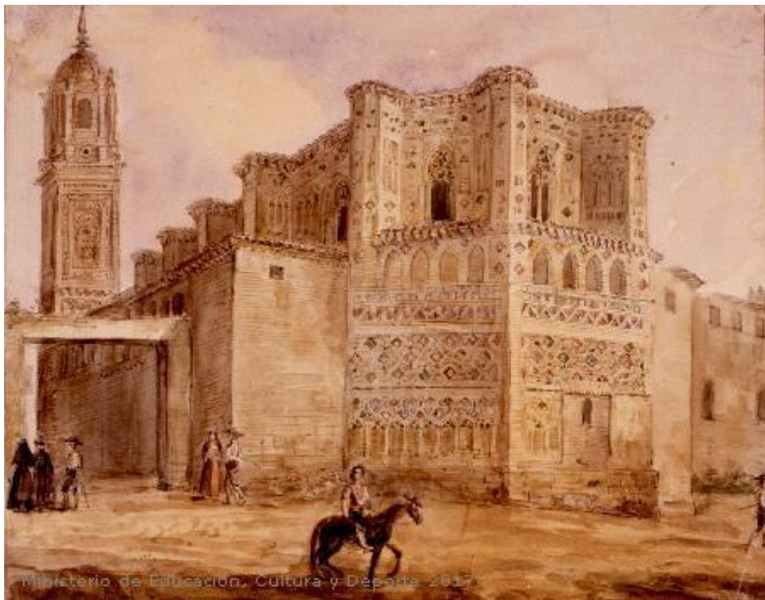
Fig.16: Vista exterior de la iglesia del monasterio de San Pedro Mártir de Calatayud (Zaragoza) . Museo Lázaro Galdiano. 1820[ca]-1880[ca]