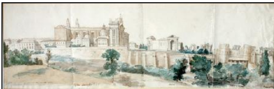
Fig.2: Vista de Roma . Museo de Huesca. 1822-1830