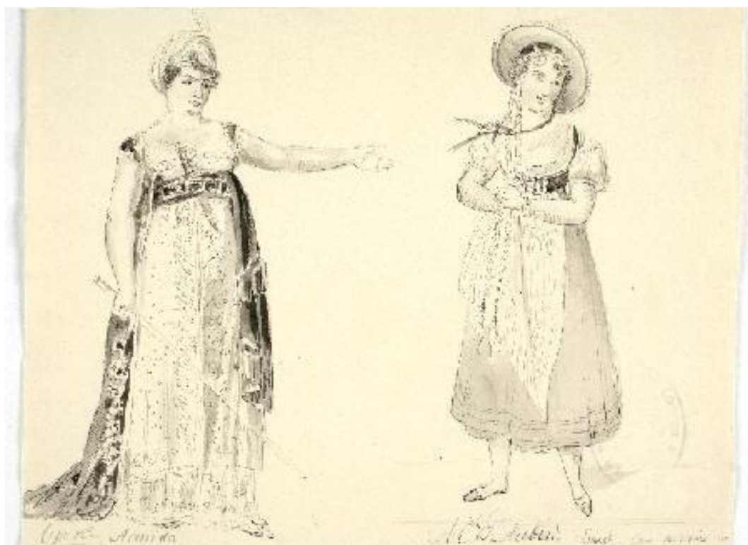
Fig.30: Indumentaria. Museo de Huesca. 1832[ca]-1880[ca]