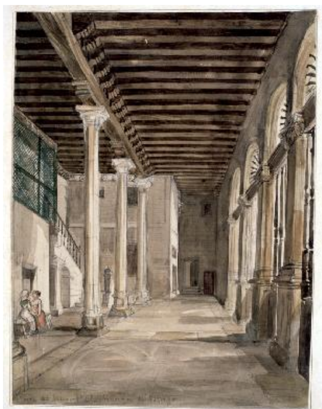
Fig.12: Vista portería del monasterio de las Huelgas de Burgos . Museo Lázaro Galdiano. 1836