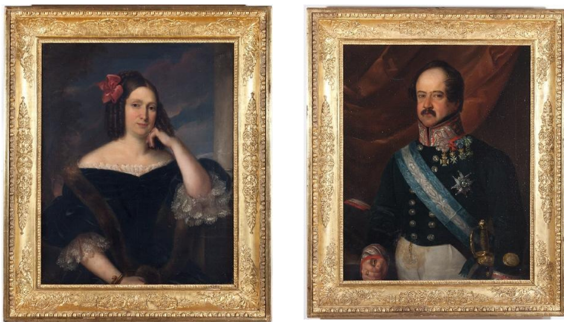
Fig.25: Marqueses de Malpica . Museo de Huesca.1837