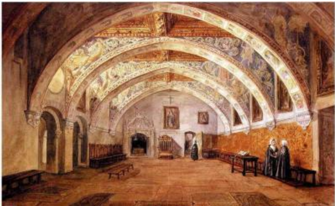
Sala capitular Monasterio de Sijena. 1840.