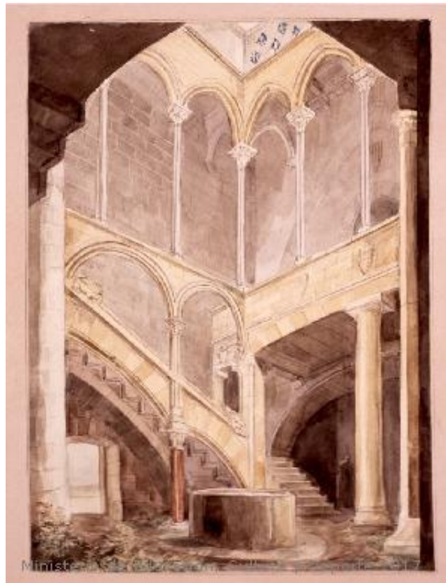
Fig.21: Palacio Real en el monasterio de Santes Creus (Tarragona) . Museo Lázaro Galdiano. 1820[ca]-1880[ca]