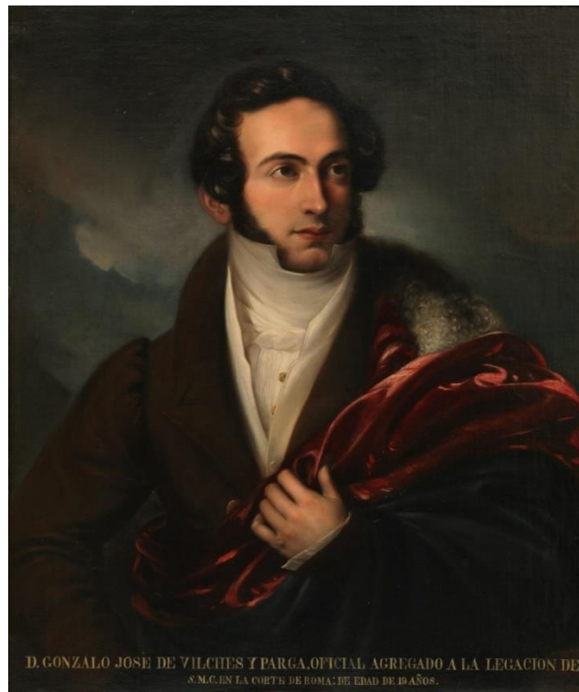
Fig.7: Gonzalo de Vilches, luego I conde de Vilches . Museo del Prado. 1827