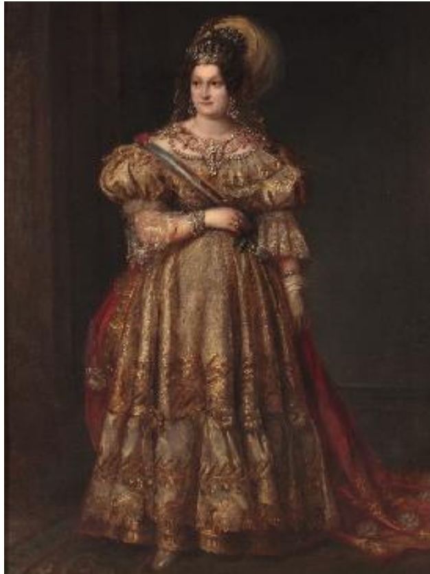
Fig.23: María Cristina de Borbón . Valentín Carderera. 1831 Museo Nacional del Romanticismo