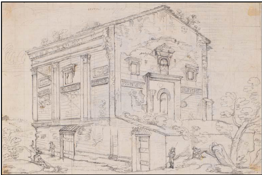
Fig.3: Copia del grabado de Piranesi del cenotafio de Annia Regilla. Museo Nacional del Prado.1823-1830