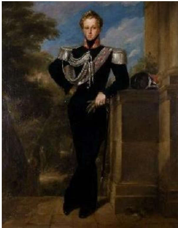
Fig.24: Mariano Téllez Girón, XII Duque de Osuna . Museo Nacional del Romanticismo. 1833