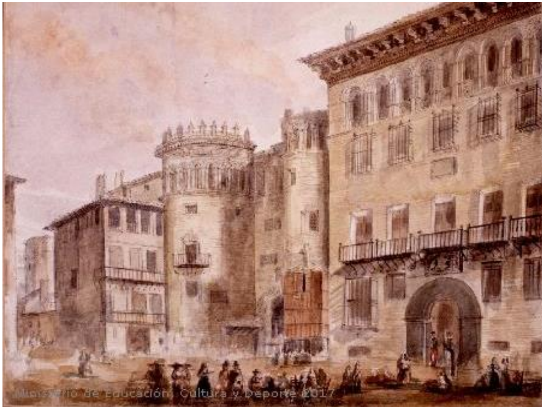
Fig.15: Plaza del mercado de Zaragoza . Museo Lázaro Galdiano. 1820[ca]-1880[ca]