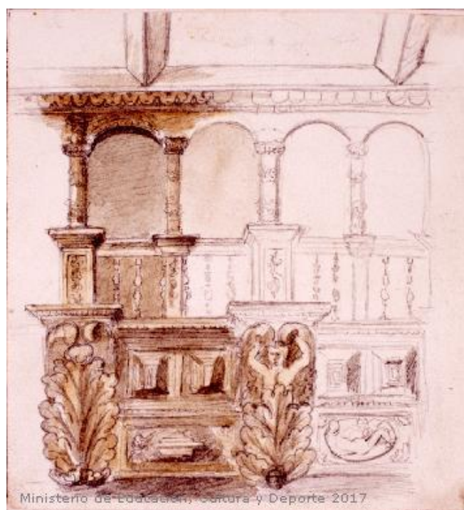
Fig.20: Detalle del palacio de la Audiencia de Valencia. Museo Lázaro Galdiano. 1820[ca]-1880[ca]