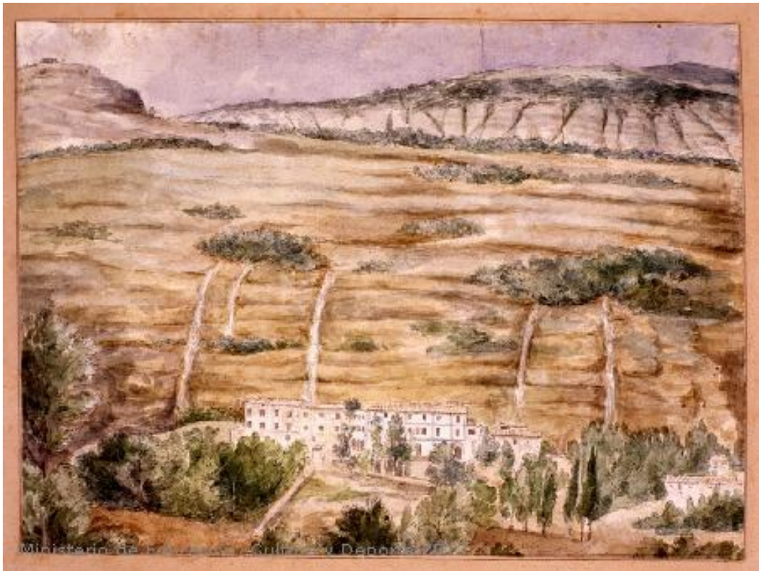
Fig.17: Vista del santuario de Guara (Huesca) . Museo Lázaro Galdiano. 1820[ca]-1880[ca]