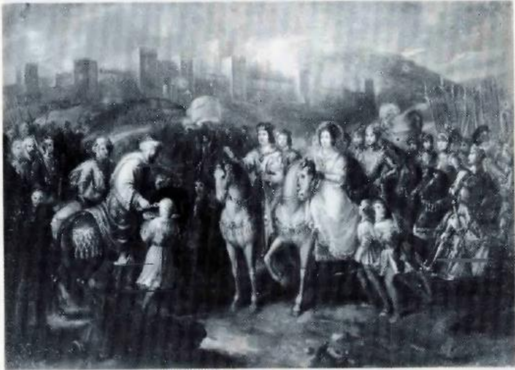
Fig.27: La rendición de granada . Foto publicada en “Valentín Carderera, Pintor” por José María Azpiroz Pascual