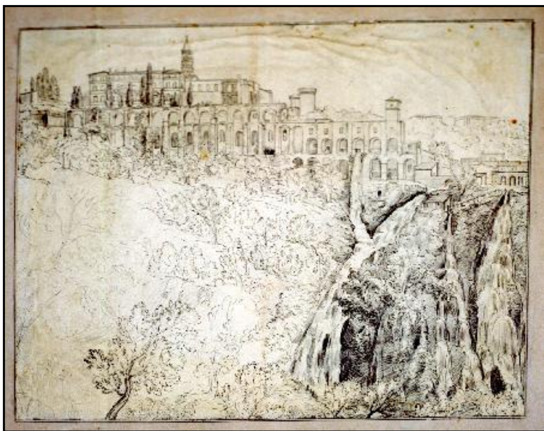
Fig.4: Vista de la villa de Mecenas en Tivoli (Italia). Museo Lázaro Galdiano. 1822-1831