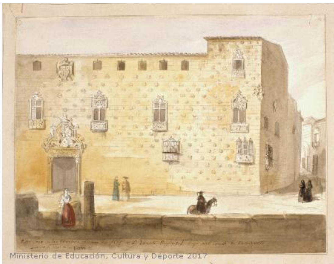
Fig.14: Vista de la fachada de la casa de las conchas en Salamanca. Museo Lázaro Galdiano. 1850