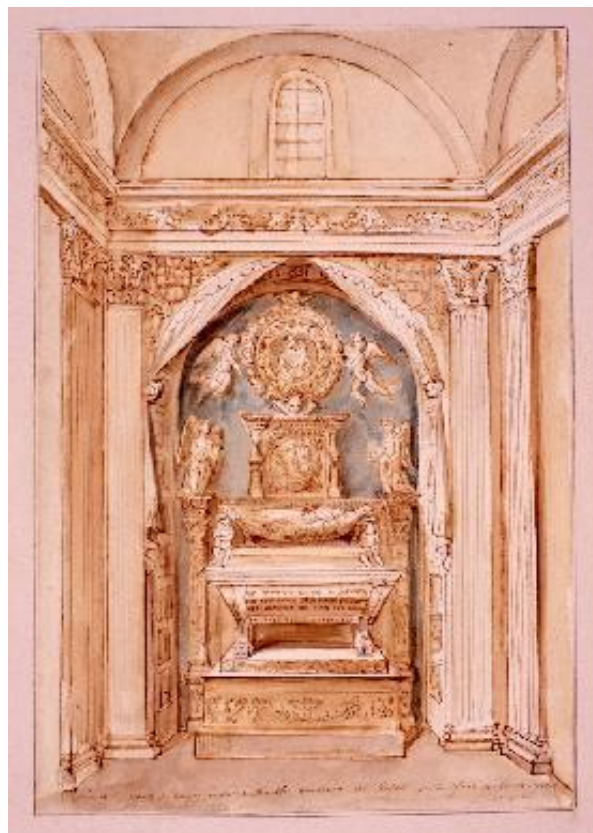
Fig.8: Sepulcro María de Aragón en Nápoles . Museo Lázaro Galdiano. 1823-1830