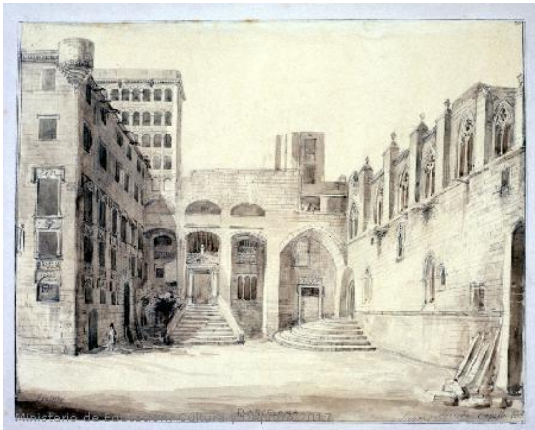
Fig.22: Plaza del Rey de Barcelona . Museo Lázaro Galdiano. 1850[ca]