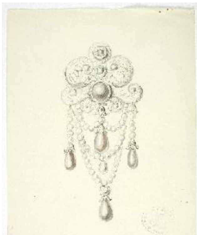
Fig.31: Joyas. Broche de la Emperatriz . Museo de Huesca. 1853[ca]-1880[ca]