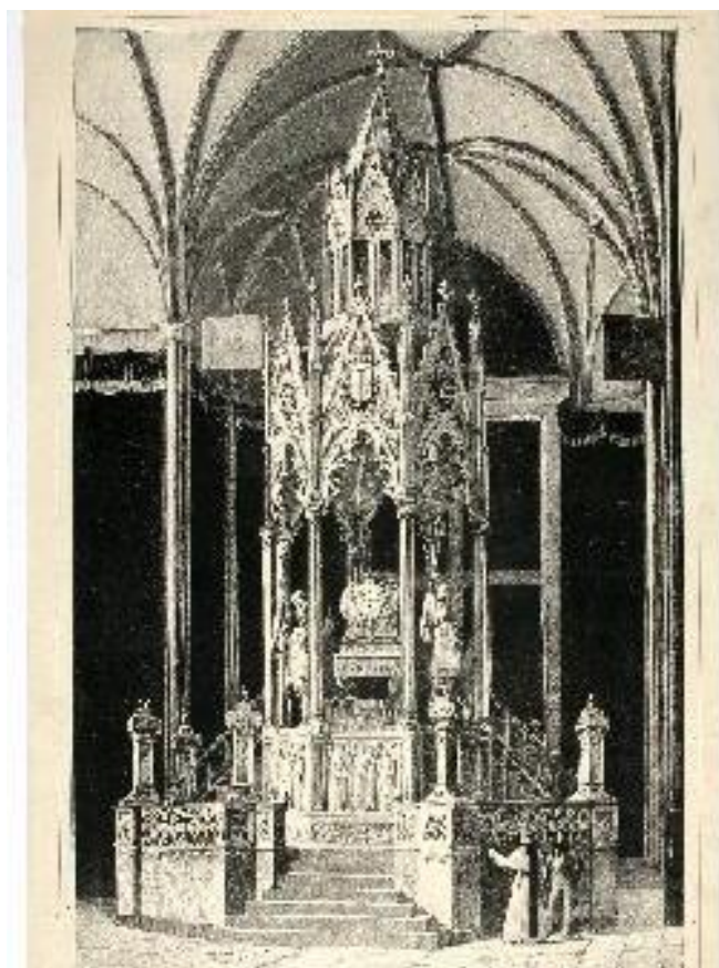
Fig. 29: Catafalco para exequias Fernando VII. Arquitectura efímera. Museo de Huesca. 1834