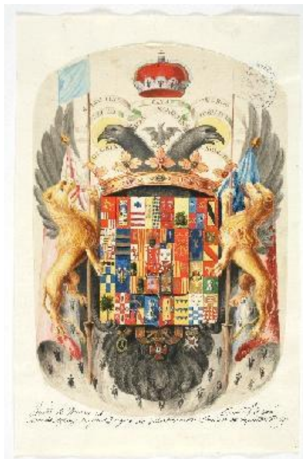
Fig.32: Escudo de Armas de D.J.A. Azlor y Aragón, Duque de Villahermosa . Museo de Huesca. 1818[ca]-1880[ca]