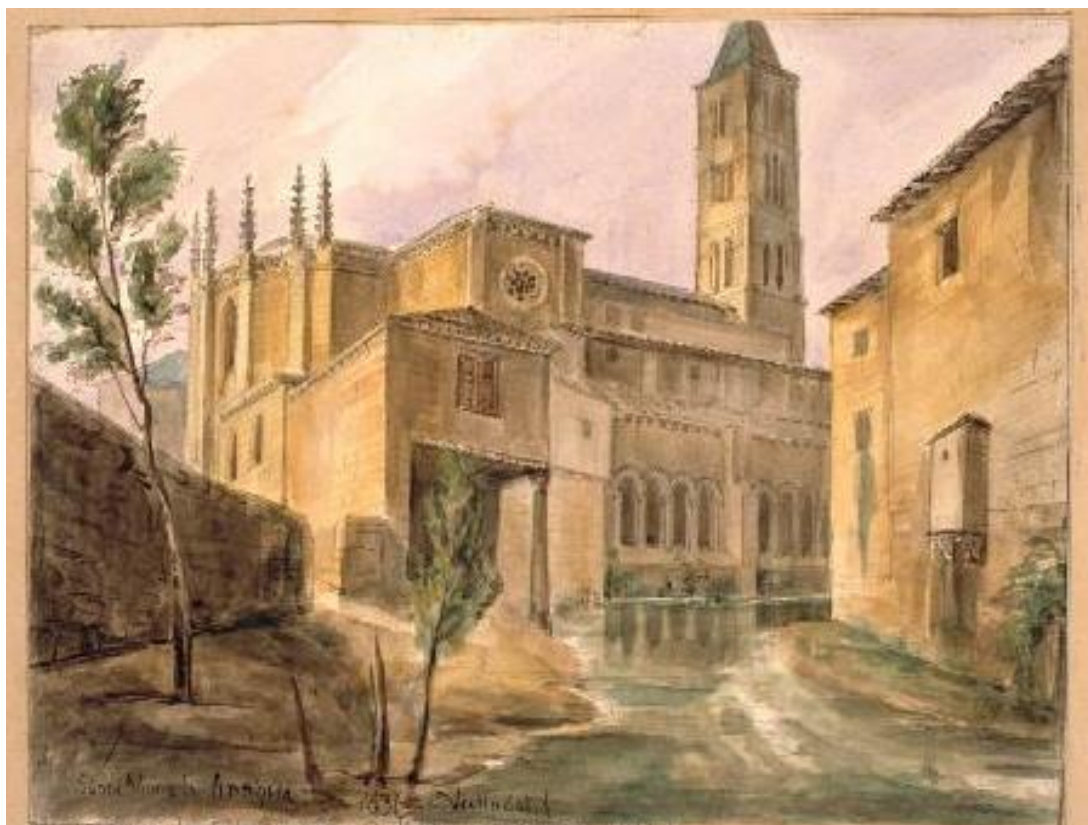
Fig.11: Vista de la iglesia de Santa María la Antigua de Valladolid . Museo Lázaro Galdiano. 1836