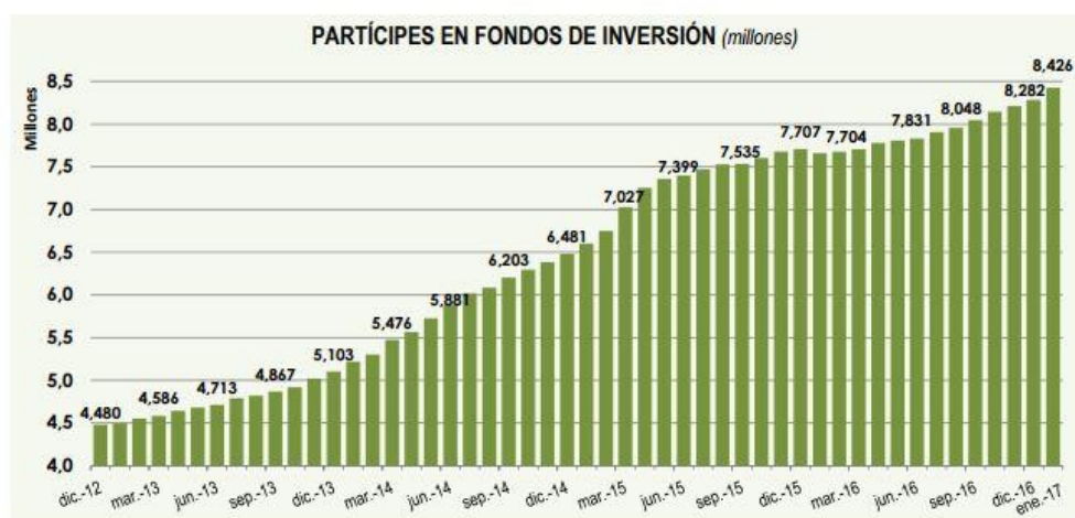
GRÁFICO 2.4. PARTICIPES FONDOS DE INVERSIÓN