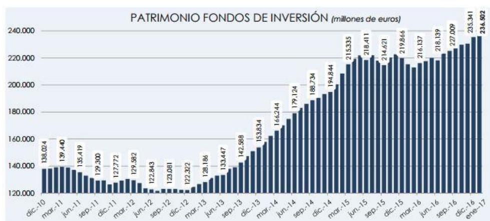
GRÁFICO 2.3. PATRIMONIO FONDOS DE INVERSIÓN

A pesar de esto, nuestro estudio de la evolución se centrará en los últimos años, para tener una visión más reciente de dicha evolución.