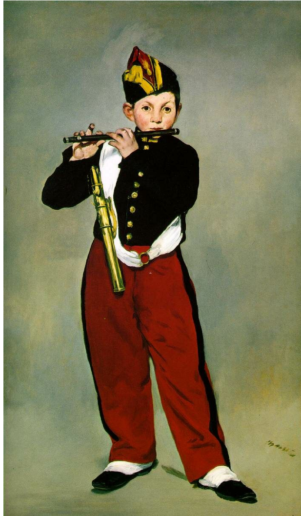
Figura 22: El Pífano , Édouard Manet (1866).