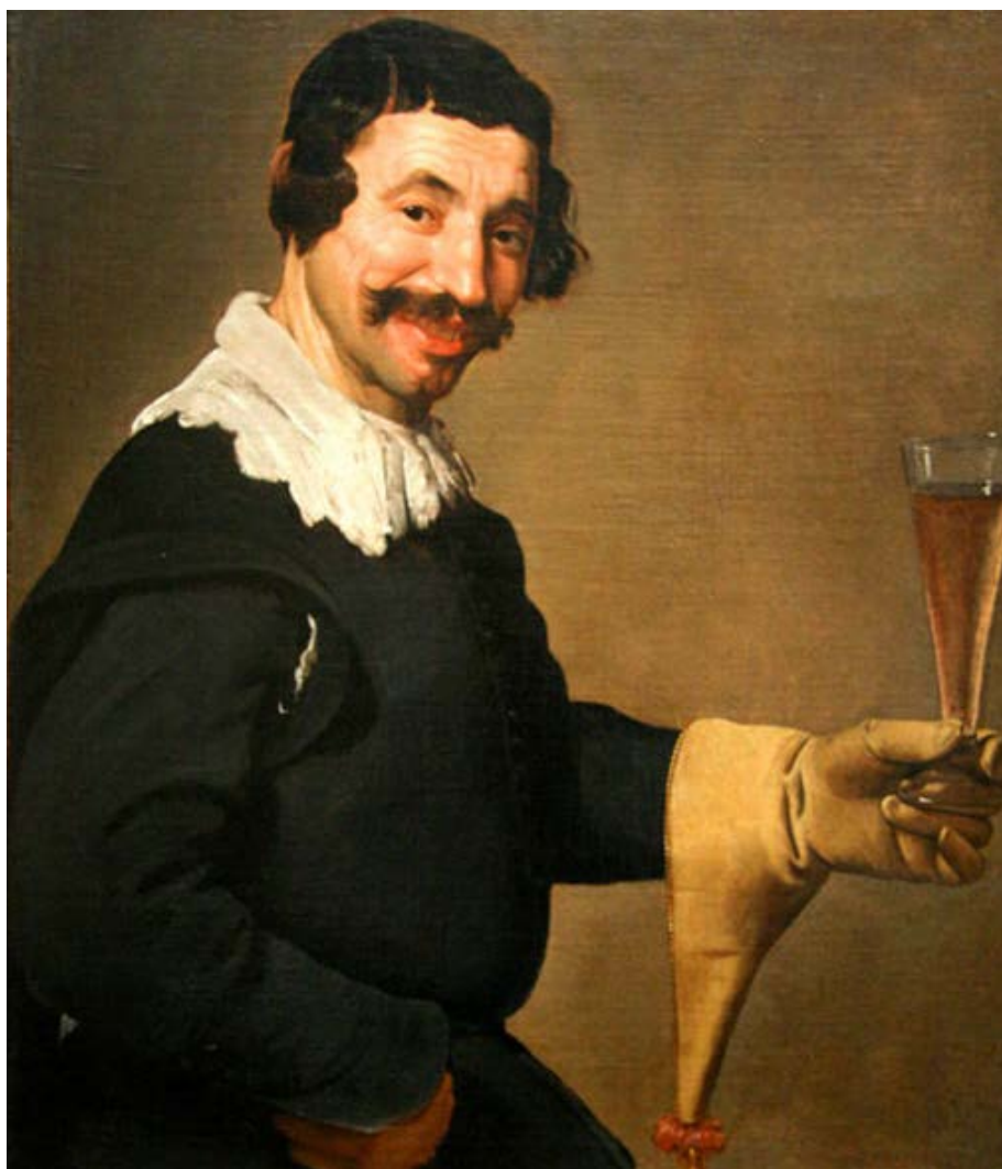
Figura 15: El gusto , Velázquez (h. 1630).