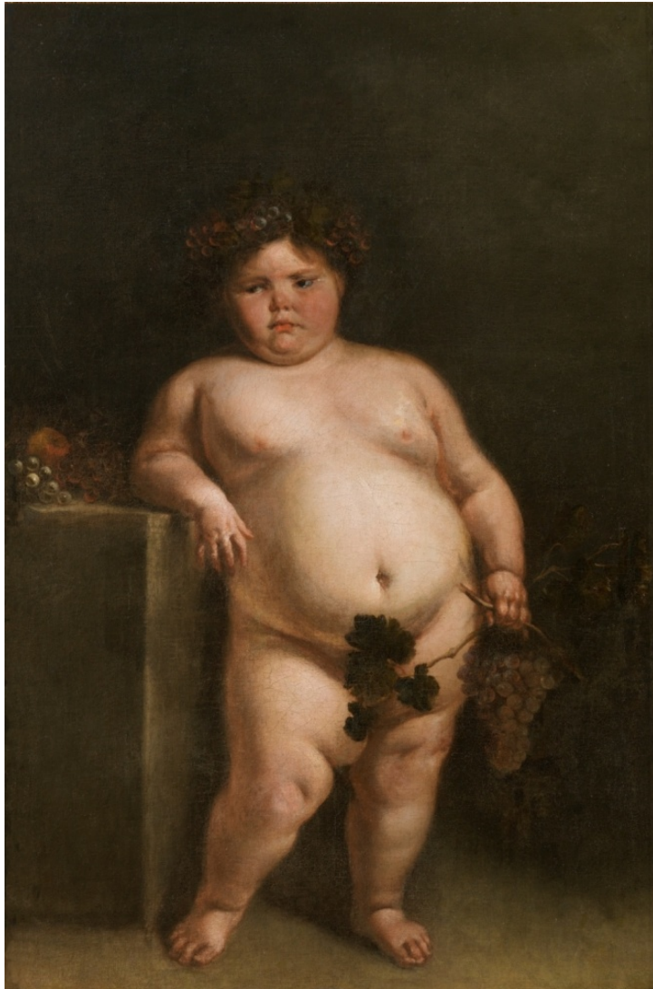
Figura 12: Eugenia Martínez Vallejo, desnuda , Juan Carreño de Miranda (1680).