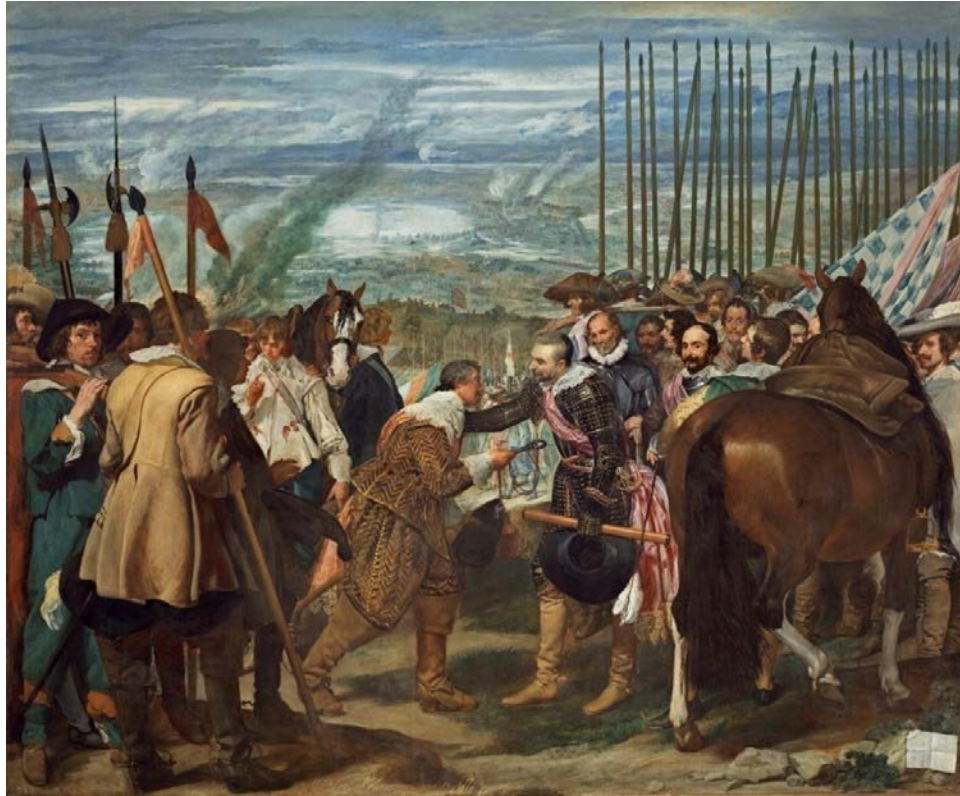
Figura 6: La rendición de Breda , Velázquez (1635).