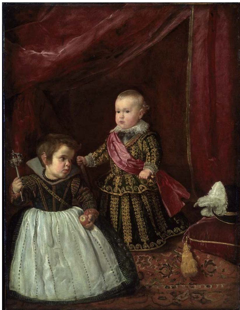
Figura 18: El príncipe Baltasar Carlos con un enano , Velázquez (1631).