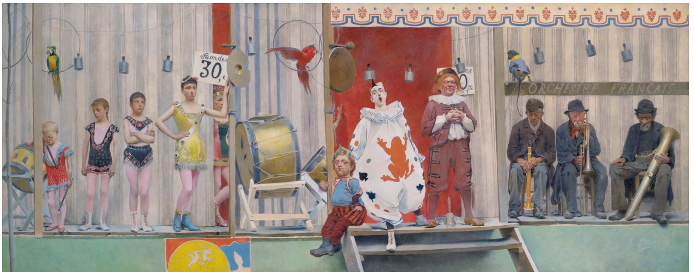
Figura 27: Grimaces et misère. Les Saltimbanques , Fernand Pelez (1888).