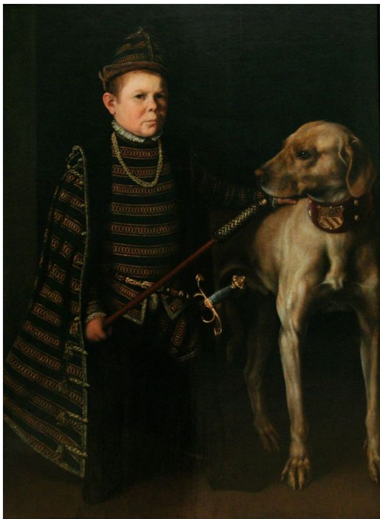
Figura 7: Enano del Cardenal Granvela , Antonio Moro (h.1549-1553).