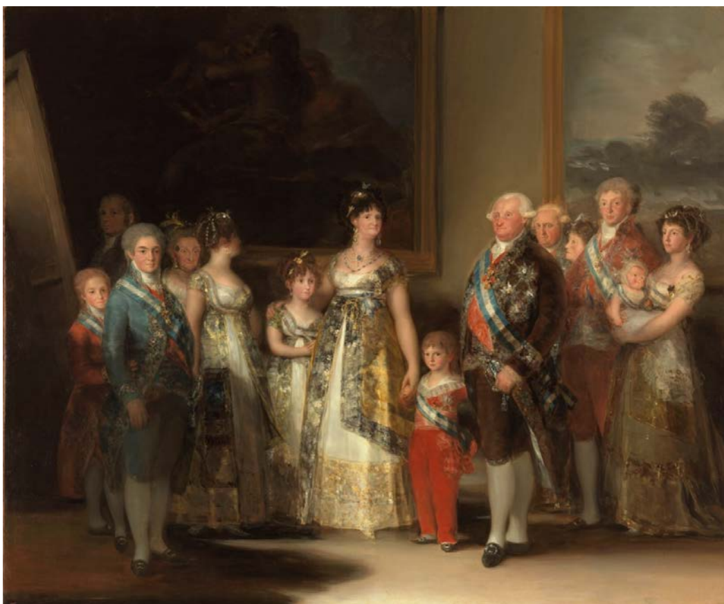
Figura 25: La familia de Carlos IV , Francisco de Goya (1801).