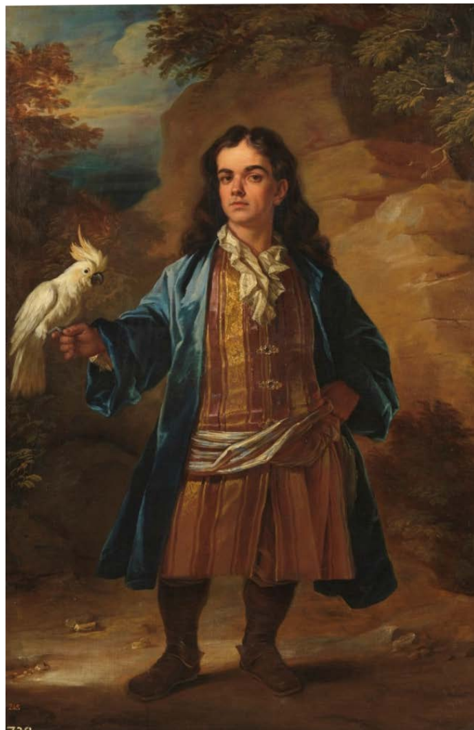
Figura 2: Retrato de enano , ¿Ángel Houasse?, ¿John Closterman? (¿h. 1726?).