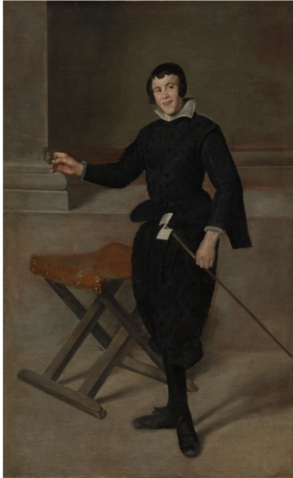
Figura 4: Portrait of the Jester Calabazas , Velázquez (h. 1626-1632).