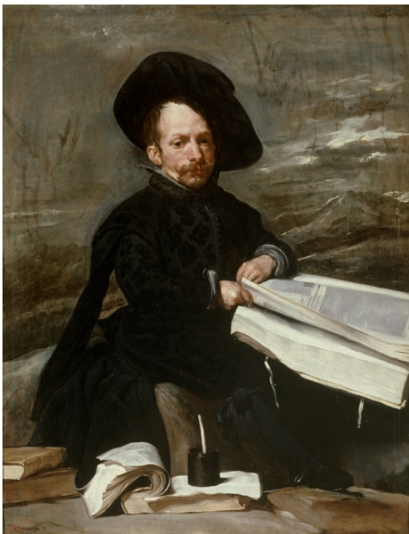
Figura 13: Bufón con libros , Velázquez (1644).