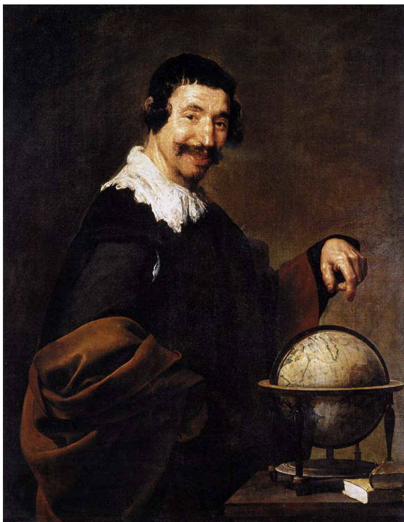
Figura 14: El geógrafo , Velázquez (h. 1627-1630).