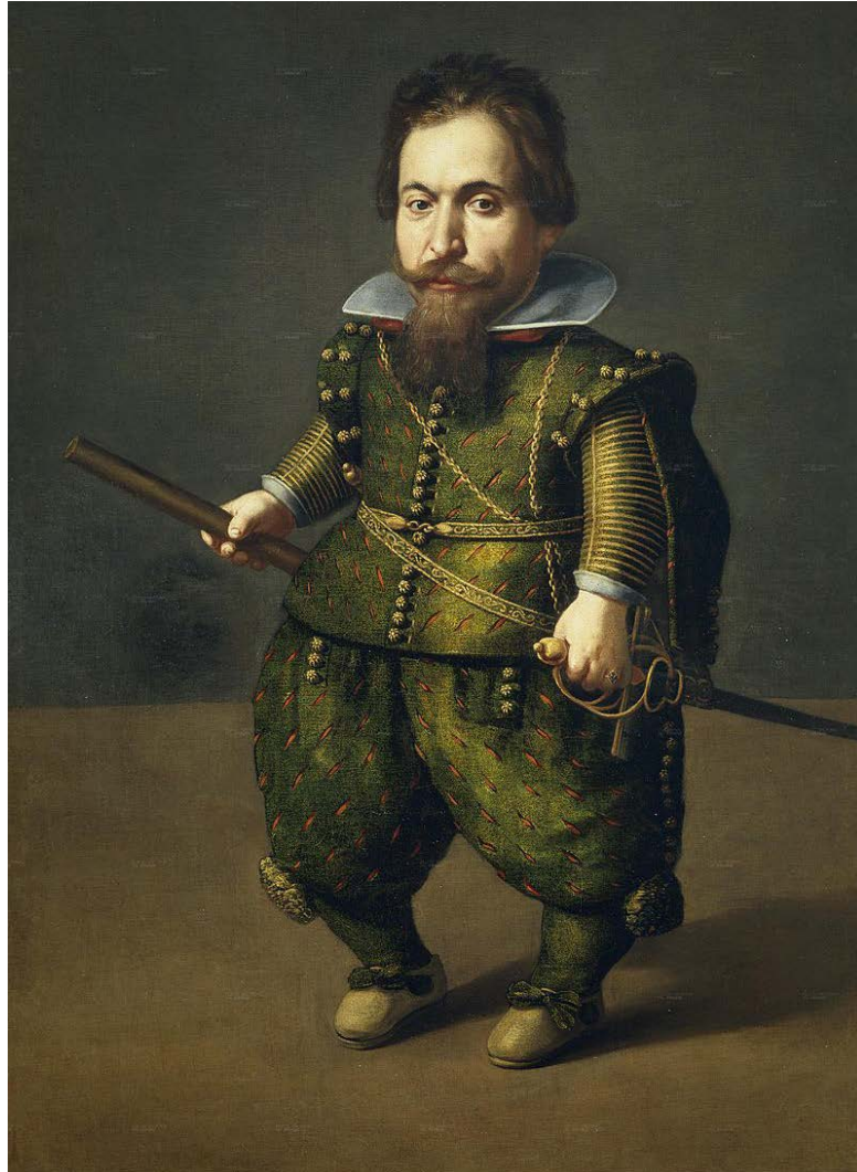
Figura 1: Retrato de enano , Juan van der Hamen (h. 1626).