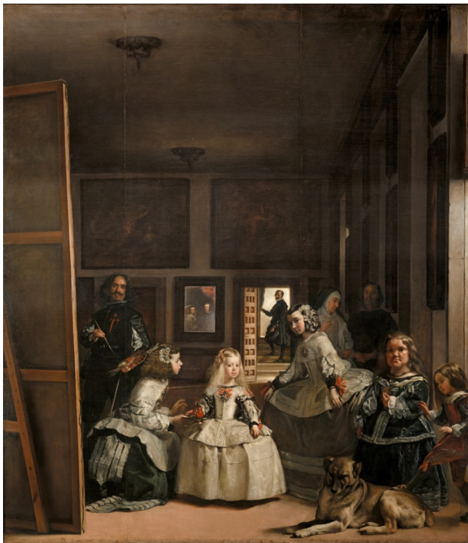
Figura 24: Las meninas , Velázquez (1656).