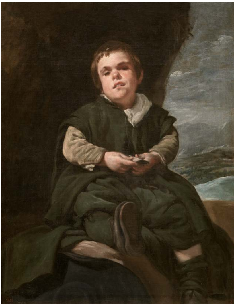
Figura 20: El Niño de Vallecas , Velázquez (h. 1635-1645).