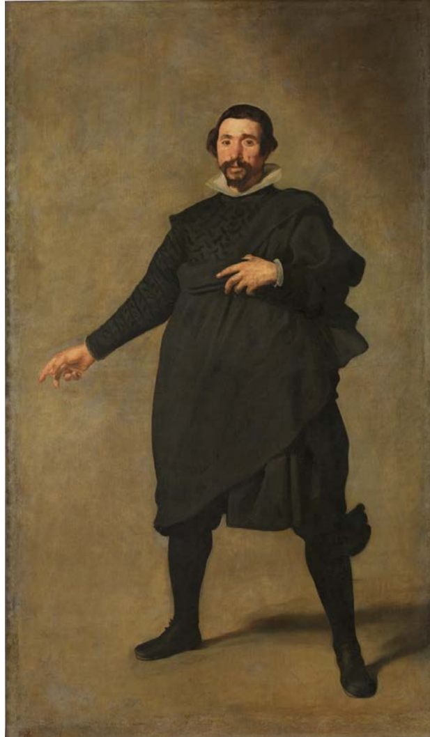
Figura 21: Pablo de Valladolid , Velázquez (1635).