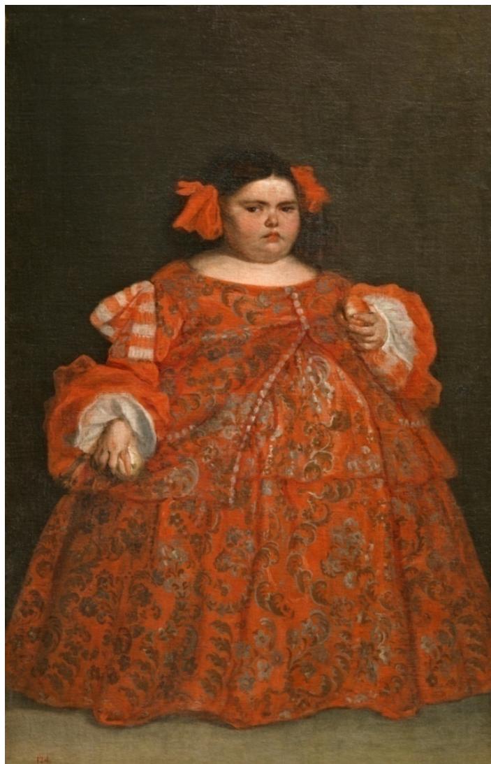
Figura 11: Eugenia Martínez Vallejo, vestida , Juan Carreño de Miranda (1680).