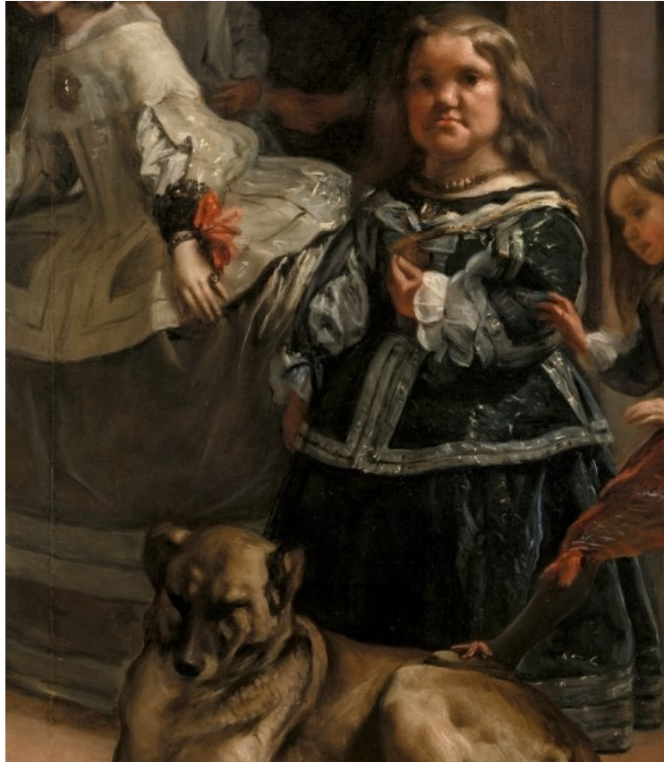
Figura 5: Las meninas . Detalle de Maribárbola, Velázquez (1656).