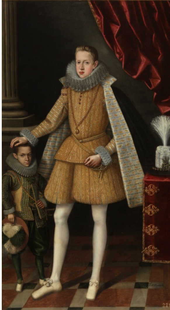
Figura 17: El príncipe Felipe y el enano Soplillo , Rodrigo de Villandrando (1620).