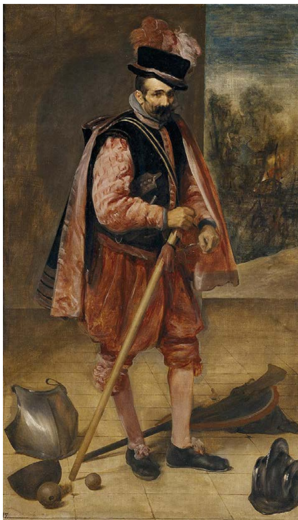
Figura 19: El bufón llamado don Juan de Austria , Velázquez (1632).