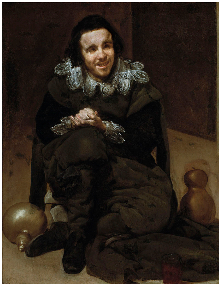
Figura 3: El bufón Calabacillas , Velázquez (h. 1635-1639).