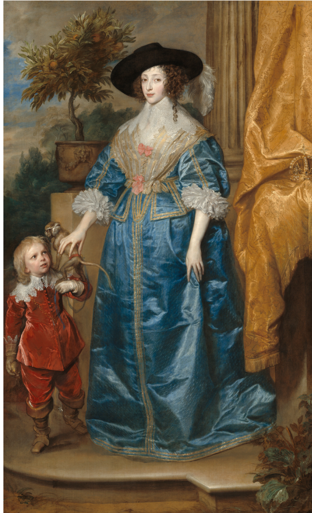
Figura 26: La reina Enriqueta María con Sir Jeffrey Hudson , Anton Van Dyck(1633).

Galería Nacional de Arte, Washington D. C.