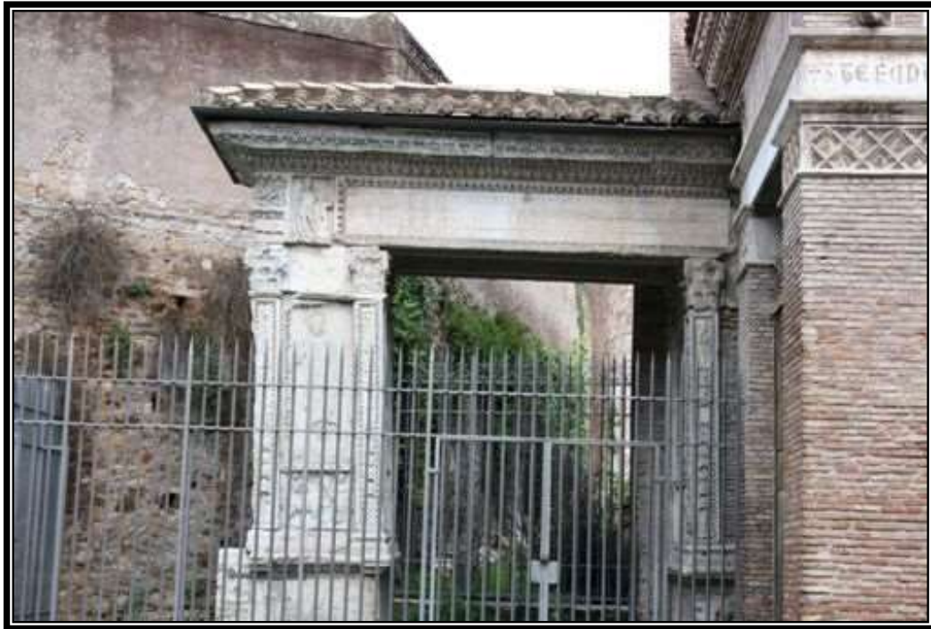
Figura 1. Arco de los Argentarios, Roma, 204 d.C.