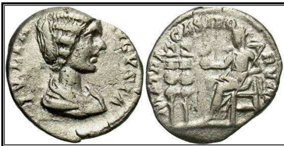
Figura 18. RIC IV, 568. IVLIA AVGVSTA. MATRI CASTRORUM