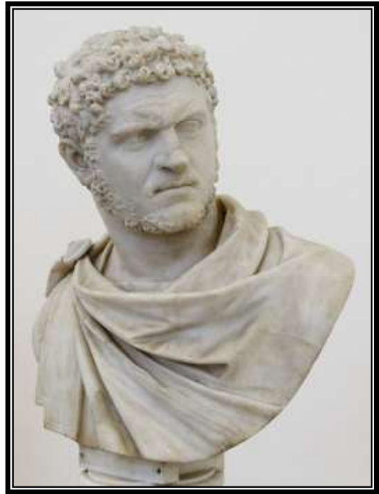
Figura 10. Busto de Antonino Bassiano “Caracalla”, Nápoles, Museo Arqueológico Nacional, 212 d.C.