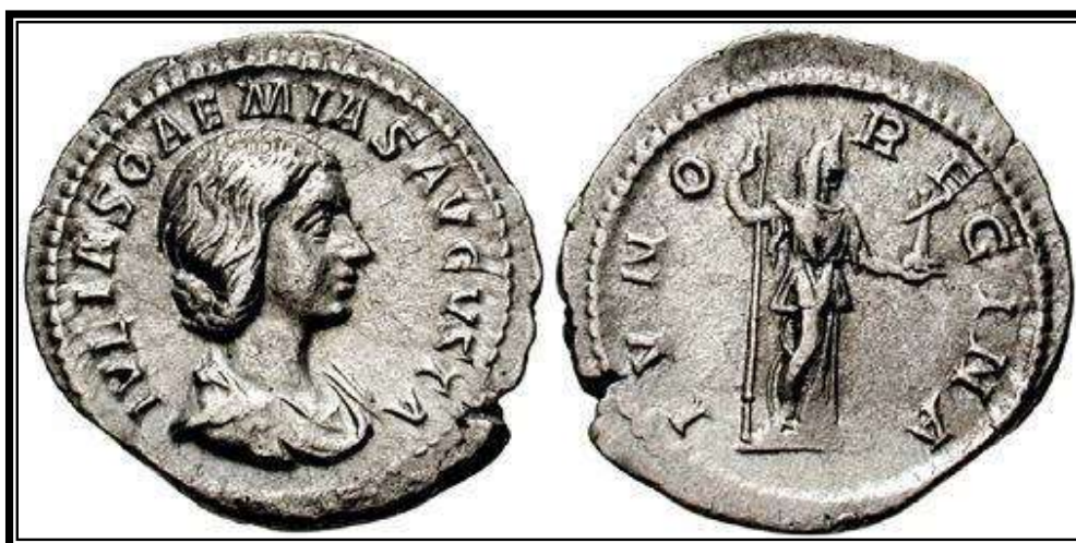
Figura 24. RIC, 237. IVLIA SOAEMIAS AVGVSTA / IVNO REGINA AVGVSTAE .