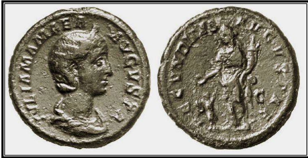
Figura 25. RIC, 669. IVLIA MAMAEA AVGVSTA / FECVNDITAS