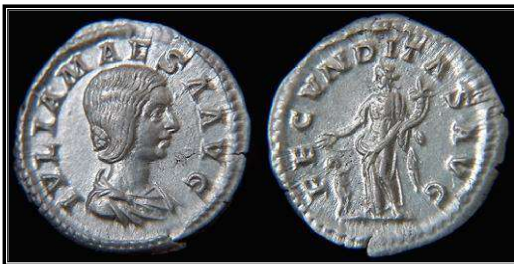
Figura 22. RIC, 249. IVLIA MAESA AVGVSTA / FECVNDITAS AVGVSTAE .