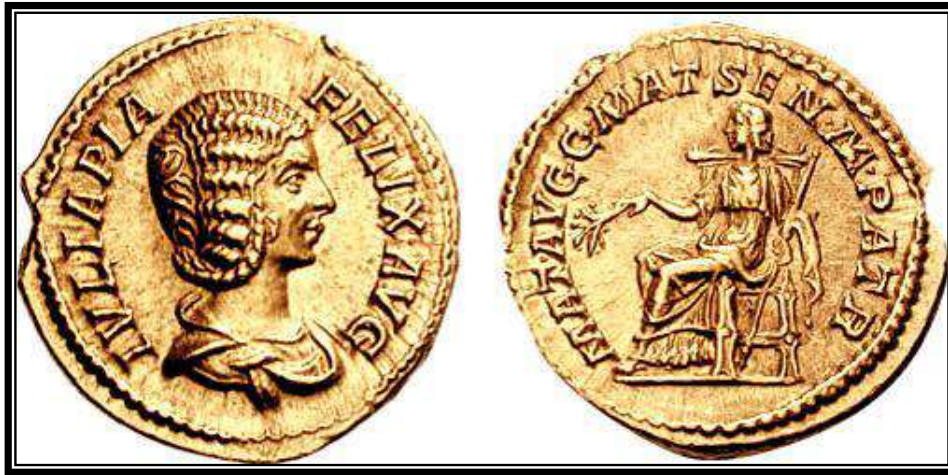
Figura 19. RIC IV, 381. IVLIA PIA FELIX AVGV. MAT. AVGV. MAT. SEN.