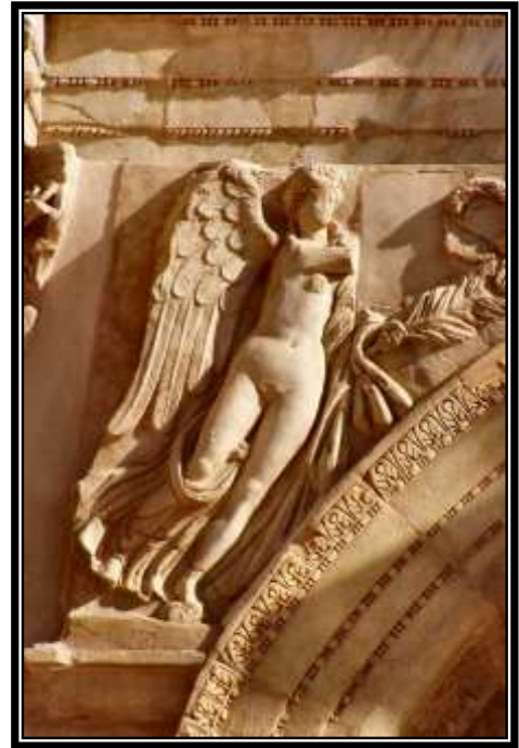
Figura 4. Detalle del Arco de Septimio Severo, Leptis Magna, Victoria alada representada como Julia Domna. 205-209 d.C.