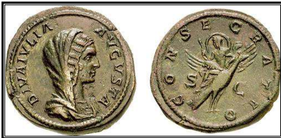
Figura 20. RIC, 716. DIVA IVLIA AVGVSTA / CONSECRATIO