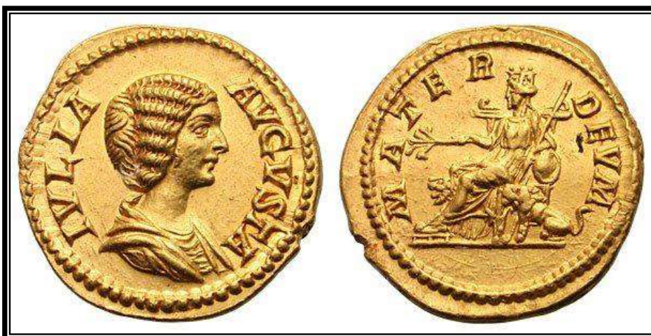
Figura 21. RIC, 565. IVLIA AVGVSTA / MATER DEVM