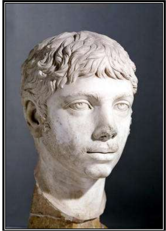
Figura 13. Busto de Heliogábalo. Roma, Museos Capitolinos, 221 d.C.