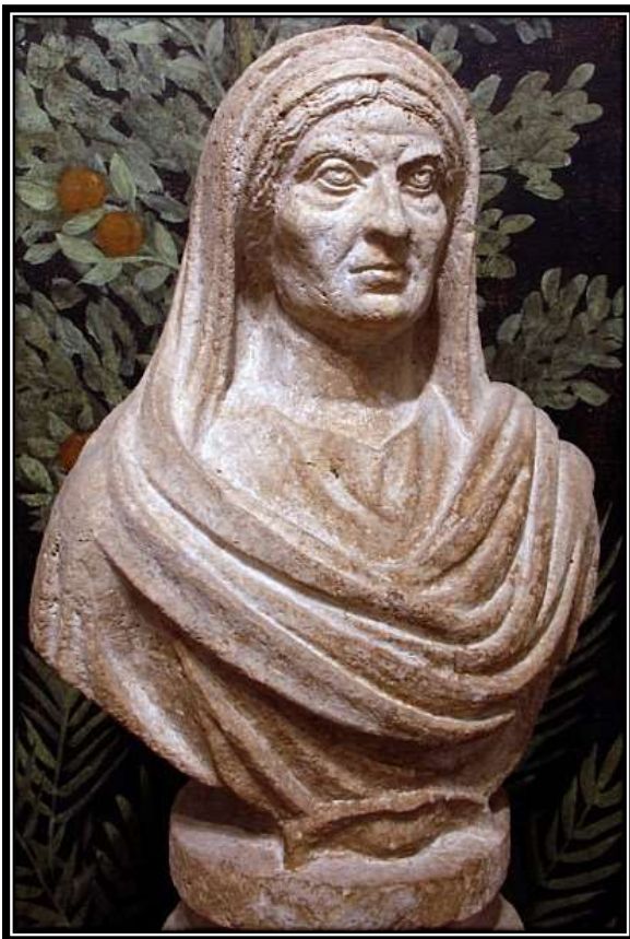
Figura 11. Busto de matrona romana, supuesto retrato de Julia Maesa. Pennsylvania, Museo de Arqueología y Antropología de la Universidad de Pennsilvanya, 218-235 d.C.