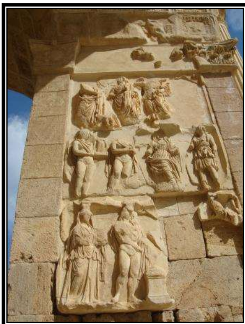
Figura 5. Detalle del Arco de Septimio Severo, Leptis Magna, 205-209 d.C.