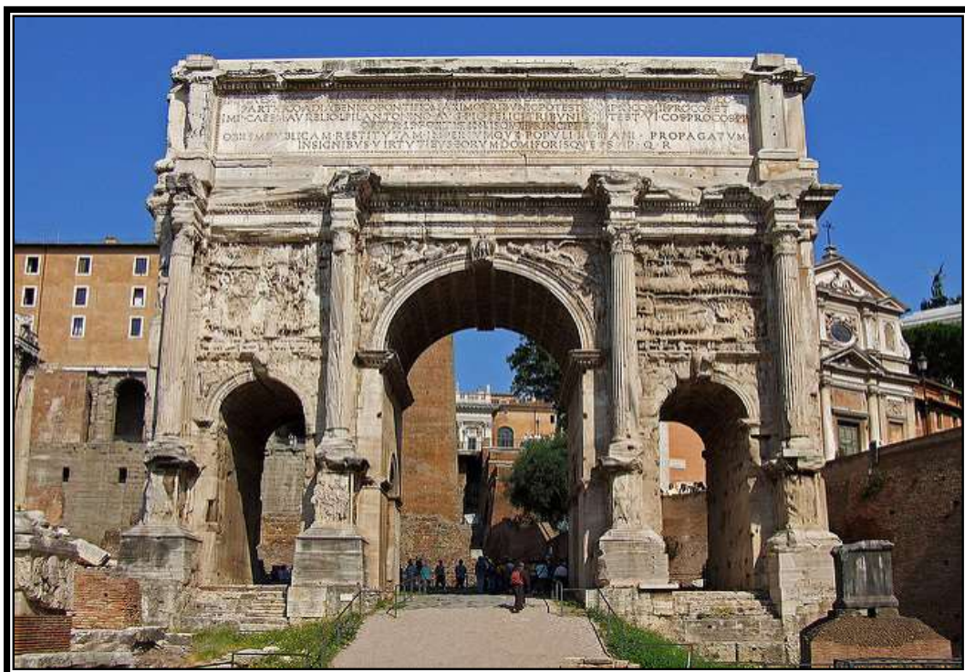
Figura 2. Arco de Septimio Severo, Roma, 203 d.C.