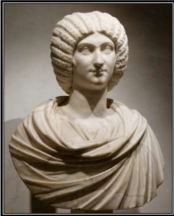
Figura 6. Retrato de Julia Domna en edad adulta. Musée des Beaux-Arts, Lyon, II d.C.