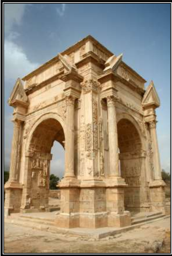
Figura 3. Arco de Septimio Severo, Leptis Magna, 205-209