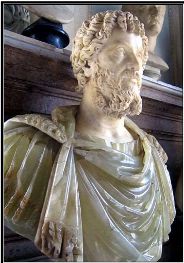
Figura 8. Busto de Lucio Septimio Severo, Roma, Museos Capitolinos, principios del siglo III d.C.