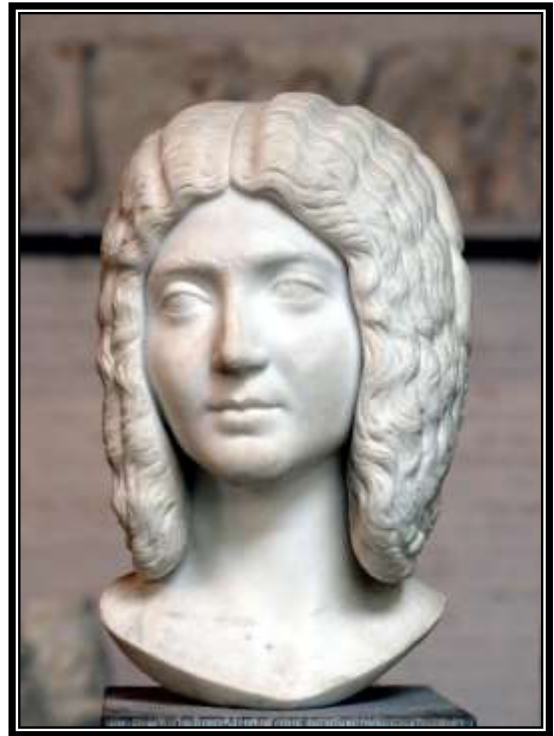
Figura 7. Retrato de la joven Julia Domna, Glyotothek, Munich, ca. 195 d.C.