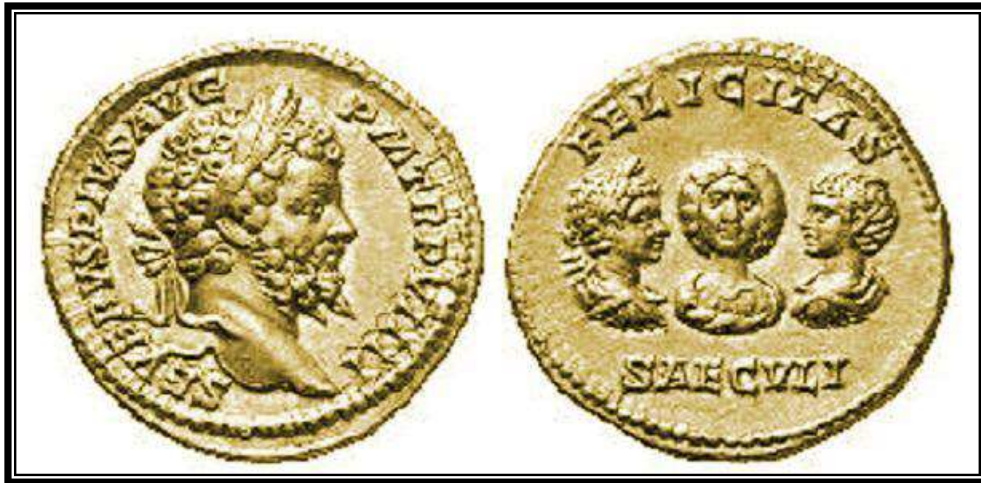
Figura 16. RIC IV, 175. SEVERUS PIVS AVG. PART. MAX. P.M. TR. P. VIII / FELICITAS SAECVLI.