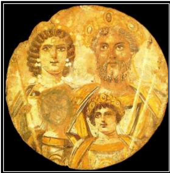
Figura 26. Tondo Severiano: La familia de Septimio Severo , Berlín, Alter Museum, ca.200