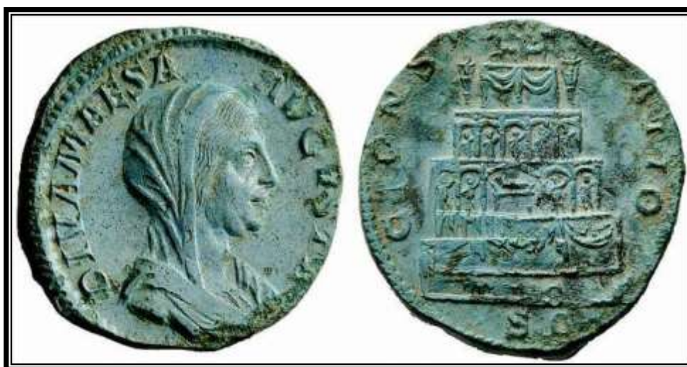
Figura 23. RIC, 712. DIVA MAESA AVGVSTA / CONSECRATIO AVGVSTAE .