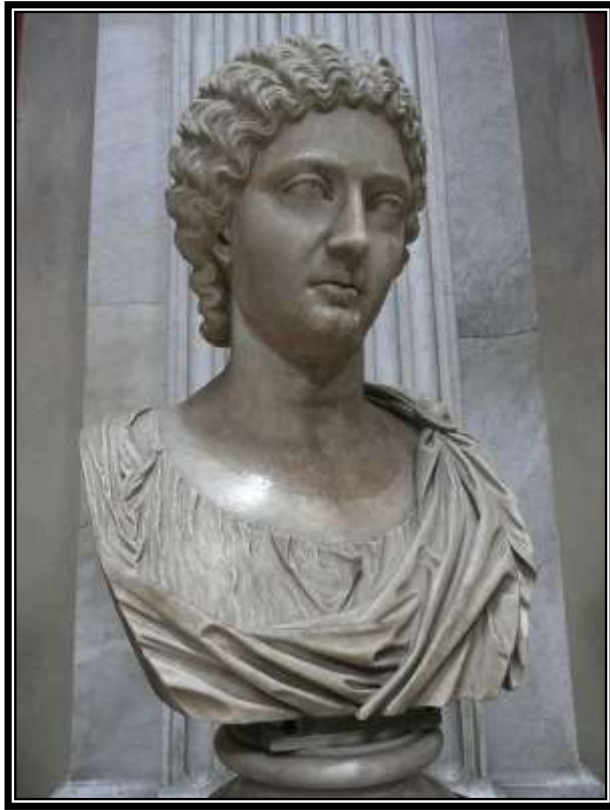
Figura 12. Supuesto retrato de Julia Soemias o Julia Mamaea, Roma, Museos Vaticanos, siglo III d.C.