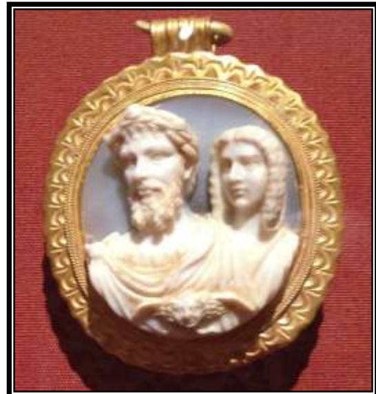
Figura 27. Camafeo de Septimio Severo y Julia Domna