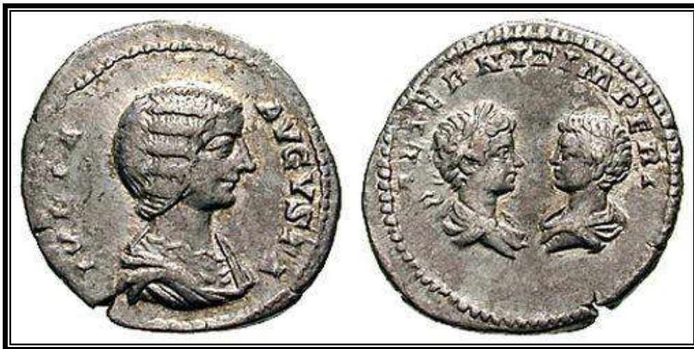
Figura 17. RIC IV, 540. IVLIA AVGVSTA AETERNIT. IMPERI