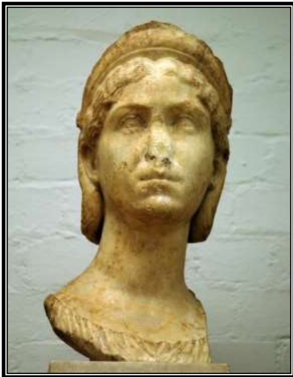
Figura 14. Busto de Julia Mamaea, Londres, British Museum, 222-235 d.C.