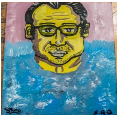
Obra realizada por Sergio Muro y Sergio Royo para el proyecto “Arte de tú a tú” – Fundación Rey Ardid