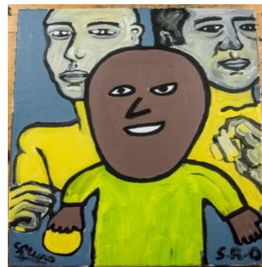
Obra realizada por Sergio Muro y Sergio Royo para el proyecto “Arte de tú a tú” – Fundación Rey Ardid