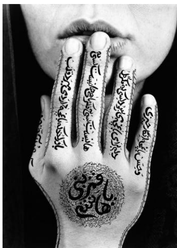
Shirin Neshat, Untitled, 1996

Se mostrarán algunas de las obras de Shirin Neshat, y si es posible, alguna fotografía del país de origen de la artista, para situar en el espacio a los alumnos. Además, para que comprendan la situación que vive el país y por la cual, Shirin realiza esas obras tan características.