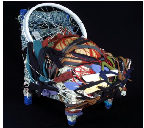
Escultura de Judith Scott. Imagen recogida en la galería fotográfica de su página web.