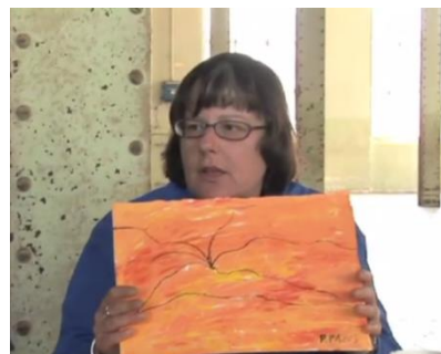
Obra de Pilar Pazos donde refleja su "infancia inocente y muy agradable".

En general, con todo lo citado anteriormente, podemos justificar el arte como una vía alternativa al tratamiento de este trastorno, puesto que, ayuda a aquellas personas que la padecen, a mejorar su sintomatología negativa y a que los que no lo padecemos, comprendamos, más empáticamente, sus pensamientos y emociones.