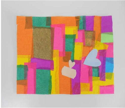
“Sensaciones de color” . Obra presentada por un niño/a con TEA al Certamen bienal de arte ARTEA