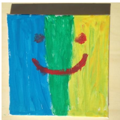
“Solo contento” . Obra presentada por un niño/a con TEA al Certamen bienal de arte ARTEA

Un ejemplo de que la creación artística es una herramienta necesaria para los niños y adultos, que presentan trastorno del espectro autista, lo lleva a cabo la Confederación Autismo España, que desde hace 4 años se dedica a la creación del Certamen bienal de arte ARTEA. Este certamen está dirigido a la participación de niños y adultos con TEA, los cuales, a través de la expresión artística, provocan la atención de la sociedad sobre la realidad que ellos viven. Con este encuentro se reconocen y difunden las obras artísticas de estas personas y se puede comprobar su gran potencial. Además, en cada edición, ha aumentado considerablemente el número de participantes, ya que, las obras pueden ser realizadas con cualquier técnica de expresión y son expuestas de manera física y virtual para que cualquier persona pueda disfrutar de sus creaciones. Este certamen ayuda a estas personas a mejorar su comunicación, y a estimular y desarrollar sus propias capacidades.