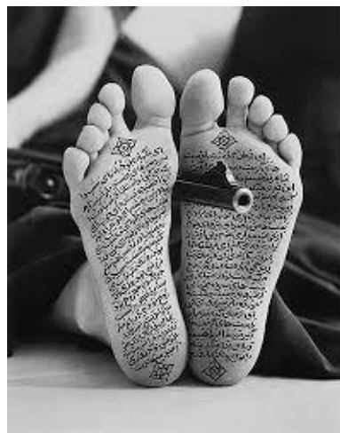
Shirin Neshat, Allegiance with Wakefulness, 1994

Como citan Martínez y López (2009) en su libro, el trabajo con esta artista pretende promover la igualdad ante la diversidad, el conocer maneras de pensar, ideas y deseos de personas diferentes a ellos, y ayudar a perder el miedo a lo diferente desde edades tempranas, entre otras.