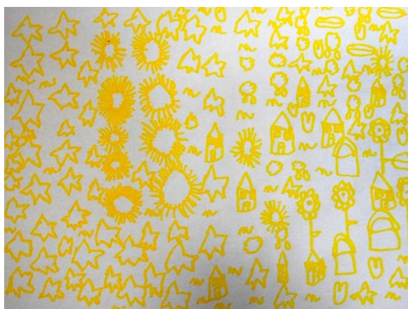
“Casas” . Obra presentada por un niño/a con TEA al Certamen bienal de arte ARTEA