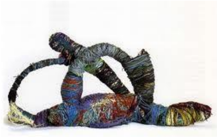
Escultura de Judith Scott. Imagen recogida en la galería fotográfica de su página web.