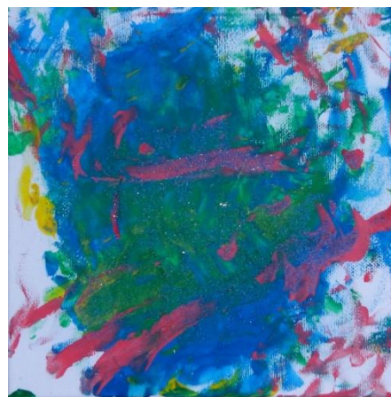
“Melancolía Furiosa” . Obra presentada por un niño/a con TEA al Certamen bienal de arte