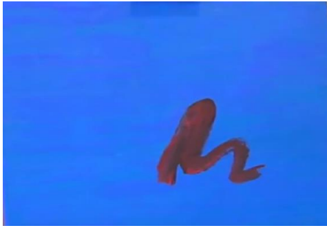
“Chatarra de sangre y cielo” – Obra ganadora del V Concurso de Pintura “Trazos de igualdad”. Autor: Raúl Viñas Martín