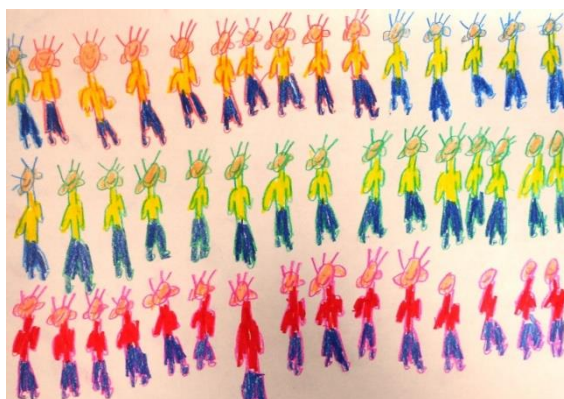
“Los niños” . Obra presentada por un niño/a con TEA al Certamen bienal de arte ARTEA