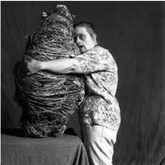
Judith Scott junto a una de sus esculturas. Imagen recogida en la galería fotográfica de su página web.