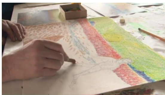
Dibujo realizado por Jordi Casanovas (Alumno del taller artístico de Lluís Gracia)