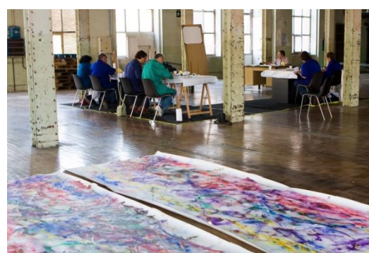
Aula del taller artístico y obras realizadas en conjunto por todos los alumnos del taller de Lluís Gracia