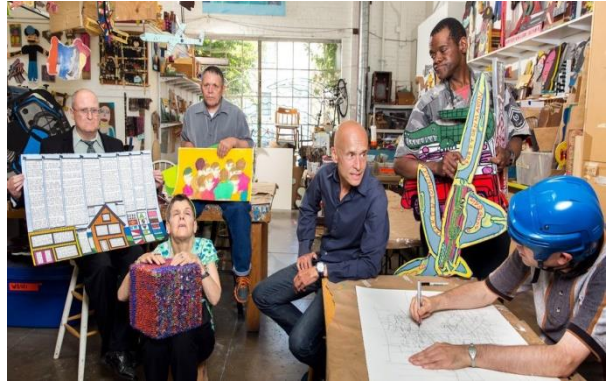
Arte Outsider realizado por algunos alumnos del Creative Growth Centre