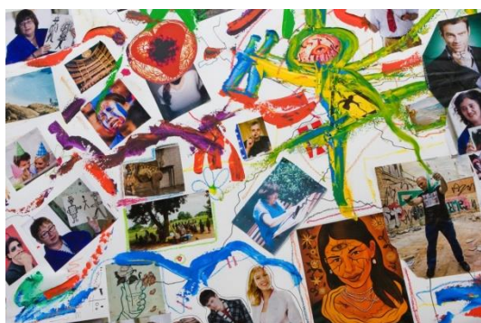
Collage realizado por todos los alumnos del taller artístico de Lluís Gracia

En el documental también se puede comprobar como los alumnos se muestran más seguros ya que empatizan con el profesor que padece el mismo trastorno que ellos. Esto les ayuda a mostrar con mayor confianza sus estados anímicos o sus sentimientos interiores.