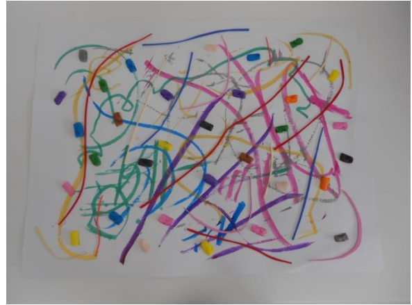
“Superándome” . Obra presentada por un niño/a con TEA al Certamen bienal de arte ARTEA

He decidido mostrar estas obras del Certamen bienal de arte ARTEA, realizadas por niños y niñas que presentan Trastorno del Espectro Autista, porque expresan tanto en la obra como en el título el beneficio comunicativo que el arte les aporta. En las obras “Solo contento”, “Melancolía furiosa”, “Superándome” o “Sensaciones de color” muestran sus sentimientos, a través del uso de colores vivos, con diferentes materiales, pero siempre mostrando ese estado interior que en ocasiones les es difícil mostrar de manera verbal. En las otras obras como “Los niños” o “Casas” se refleja la visión que ellos tienen del mundo y esa tendencia a realizar la repetición, una y otra vez y de manera casi idéntica, del tema que quieren reflejar.