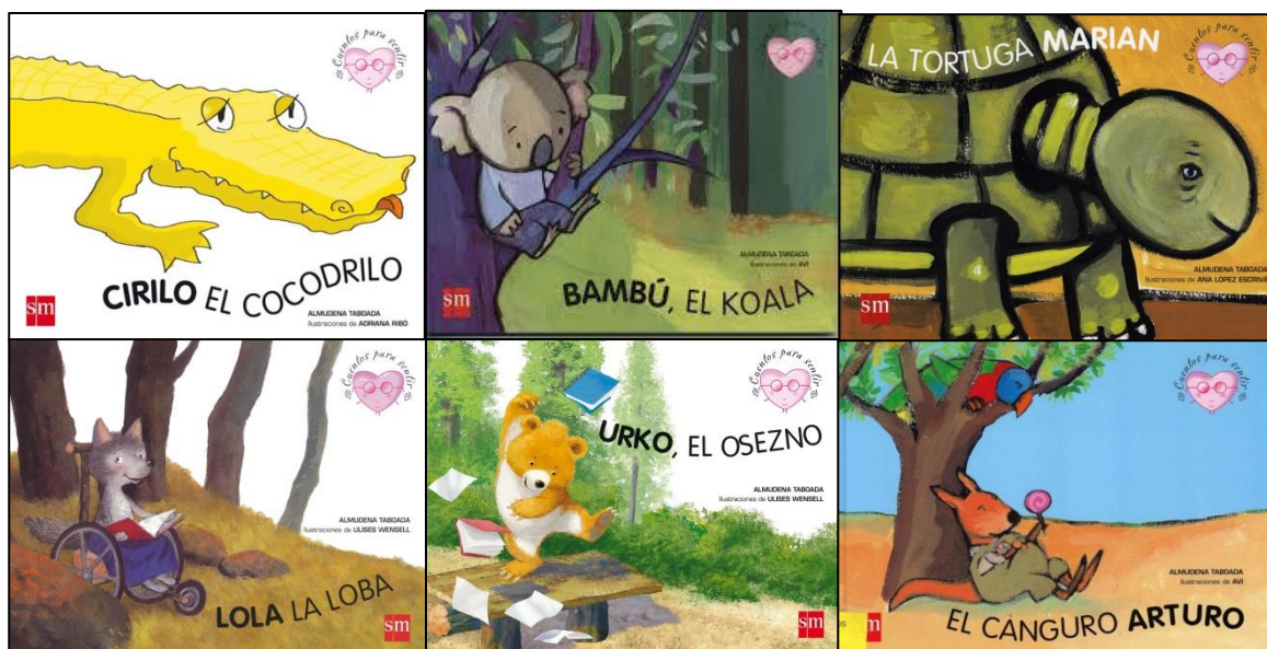
Colección "Cuentos para sentir". Autora: Aludena Taboada. Ed: SM

Los 5 minutos restantes serán para volver cada uno a su sitio, recoger y ordenar la clase.