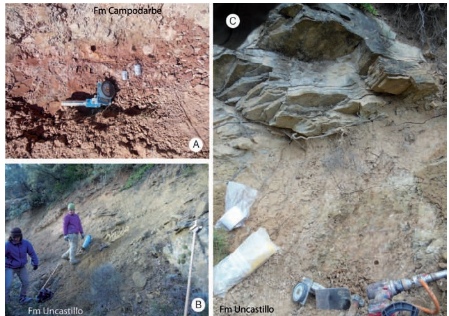
Fig. 2.- A) Zona de muestreo en la Fm Campodarbe de la sección de Luesia. B y C) Afloramiento de la Fm Uncastillo en la sección de Fuencalderas. Figura en color en la web.

La medida de la anisotropía de la susceptibilidad magnética se ha realizado en el Laboratorio de Paleomagnetismo CCITUB-CSIC con un KLY-2, y en el Laboratorio de la Universidad de Zaragoza con un KLY-3 (AGICO Inc.). El procesado de datos se ha realizado con el programa Anisoft 4.2 siguiendo los parámetros de Jelinek (1981). La susceptibilidad magnética ( k_m ) se representa por medio de un tensor de segundo orden que tiene su expresión geométrica en el elipsoide magnético. Los parámetros de forma que definen el elipsoide magnético son la lineación magnética ( L = k_{max}/k_{int} ), la foliación magnética ( F = k_{int}/k_{min} ), el grado de anisotropía corregido ( P' ), que indica la intensidad de la orientación preferente de minerales y el parámetro de forma T , donde las formas prolatas tienen valores -1 < T < 0 y las formas oblatas son 1 > T > 0 . Además,