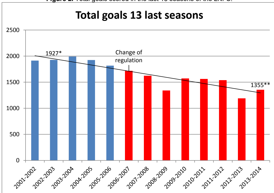
Figure 2. Total goals scored in the last 13 seasons of the LNFS.

(*120.38±28.58 goals per team; **90.40±27.72 goals per team; p=0.004)