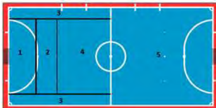
Figure 1. Definition zones

Zone 1 (Z1): goalkeeper area; Zone 2 (Z2): from 6m line to double penalty point, that is to say, 10m line; Zone 3 (Z3): sidelines of the opponent field; Zone 4 (Z4): from 10m line to midfield; Zone 5 (Z5): own field.