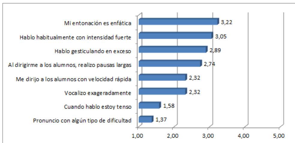
Figura 2. Ítems 25-32 Percepción de sus aptitudes comunicativas

Respecto a sus aptitudes comunicativas, tal y como refleja el gráfico 2, los maestros no parecen mostrar ningún tipo de problema de expresión comunicativa, incluso sitúan todas sus respuestas por debajo de la indiferencia. La excepción la encontramos en la entonación enfática (3,22) y su comunicación con intensidad fuerte (3,05) que están ligeramente en la indiferencia. Esto implica que los docentes se sienten seguros con sus aptitudes de transmisión y comunicación.