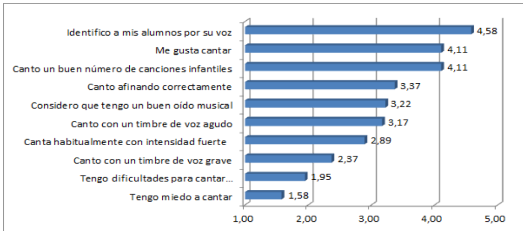
Figura 1. Ítems 15-24. Percepción de sus aptitudes musicales

Respecto a sus aptitudes comunicativas, tal y como refleja el gráfico 2, los maestros no parecen mostrar ningún tipo de problema de expresión comunicativa, incluso sitúan todas sus respuestas por debajo de la indiferencia. La excepción la encontramos en la entonación enfática (3,22) y su comunicación con intensidad fuerte (3,05) que están ligeramente en la indiferencia. Esto implica que los docentes se sienten seguros con sus aptitudes de transmisión y comunicación.