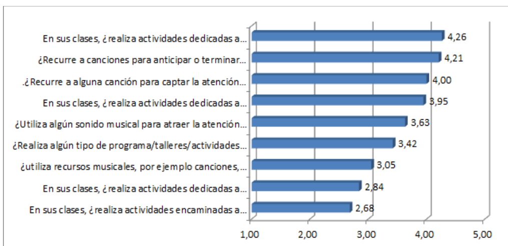
Figura 4. Ítems 46-54. Valoración de la Educación Auditiva en el aula

Continuando con la valoración de la educación auditiva en el aula (gráfico 4), la mayoría de las respuestas están por encima de la media, encontramos de mayor a menor medida que los maestros trabajan principalmente la relajación (4,26) y recurren a canciones para anticipar o terminar alguna de las rutinas escolares (4,21). También realizan actividades dedicadas a trabajar la respiración (3,95) y actividades encaminadas a la prevención de las dificultades del lenguaje (3,42). Sin embargo, muy pocos realizan actividades dedicadas a trabajar y desarrollar la entonación, así como la percepción del acento musical y prosódico.