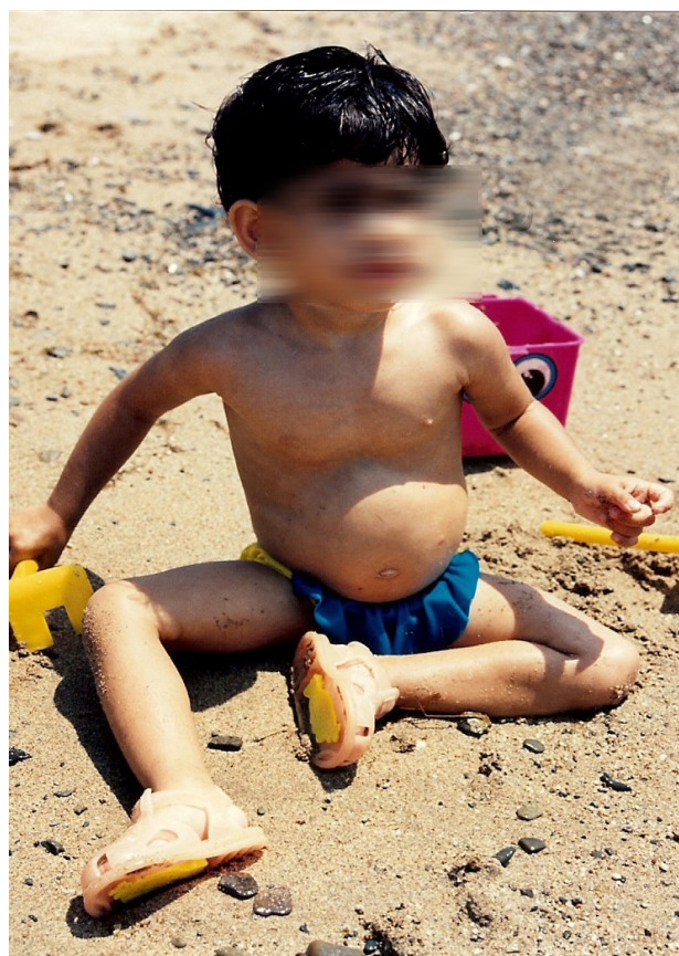
Figura 3: Niña con FQ