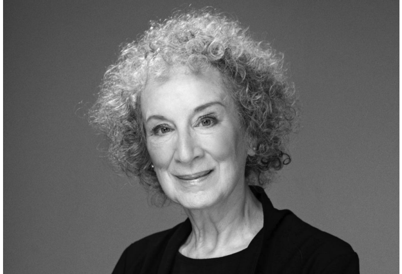
Margaret Atwood para The Paris Review.