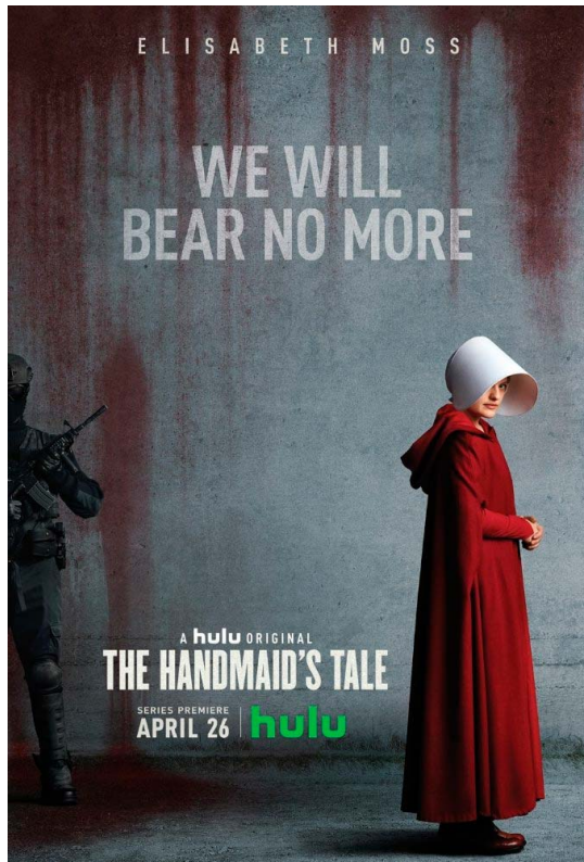
Cartel de la primera temporada. Hulu