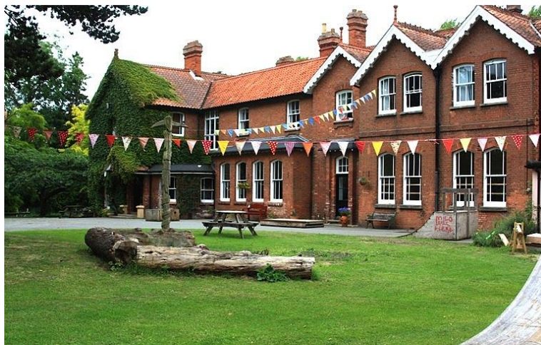
"Figura 1": Edificio principal de la escuela Summerhill.

El contraste con la escuela y sociedad tradicional se hace notar cuando los alumnos acuden a Summerhill, a pesar de esto, no se lleva ninguna medida especial para la integración, se confía en la vida en sociedad para conseguir esto (Neill, 1960).