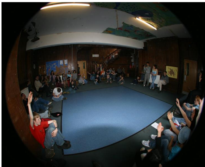
“Figura 2” : Asamblea en Summerhill

organización y resultado. Si fallan, la sociedad falla, por lo que la convivencia se complica.