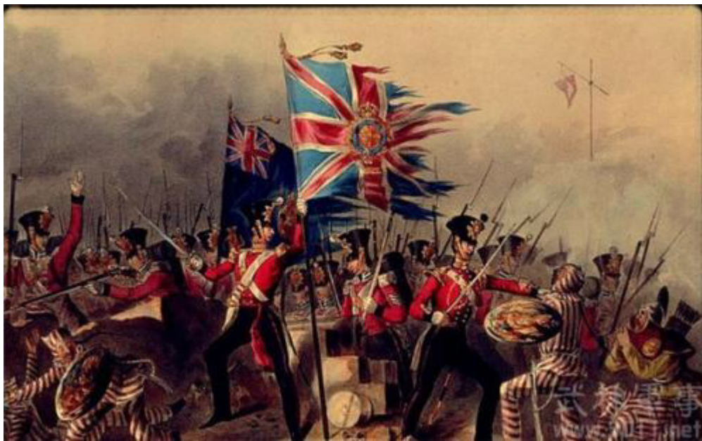
(La imagen es sobre el ejército de Gran Bretaña)

En Occidente, el ejército estaba equipado con armas avanzadas, y se creó y desarrolló un nuevo ejército moderno. La marina estaba equipada con buques de guerra avanzados, por ejemplo: los británicos, alemanes, portugueses, franceses y otros países, al mismo tiempo, guiados por teorías militares. Pero en los tiempos modernos, el equipo militar de China quedaba rezagado con respecto de los países occidentales en general. Durante mucho tiempo, el ejército Qing usó armas blancas para luchar contra las potencias occidentales. Hasta la Rebelión del Boxeador en 1900, los soldados todavía equiparon las armas primitivas, como cuchillos grandes y lanzas.