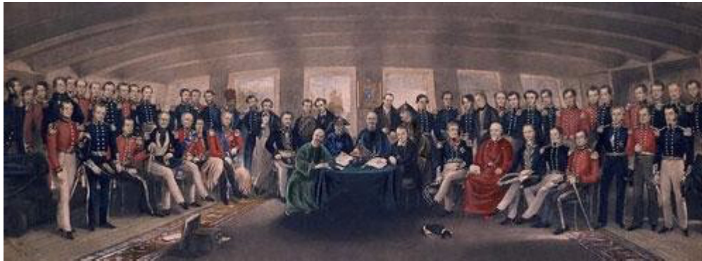
(La foto es sobre el "Tratado de Nanjing", cuando firmaron entre el Gran Bretaña y China.)

Como se mencionó anteriormente, la dinastía Qing había despreciado a los británicos, pero a través de los siglos encontró que Gran Bretaña fue un enemigo poderoso y inteligente, la diferencia es, el emperador Daoguang, su hermano menor Qi Shan, los oficiales como Yili Bu, Liu Yun Ke, etc, les daban miedo del poder de las armas y cañones, después, en cada guerra, los gobiernos eligieron rendirse al Inglaterra. Afortunadamente, Lin Zexu, Wei Yuan, Tang Ting Chen, Yao Jian Ying y otras insistieron oponerse, lo hicieron despertó toda la nación, la gente sacó las lecciones del dolor profundo, para aprender de Occidente.