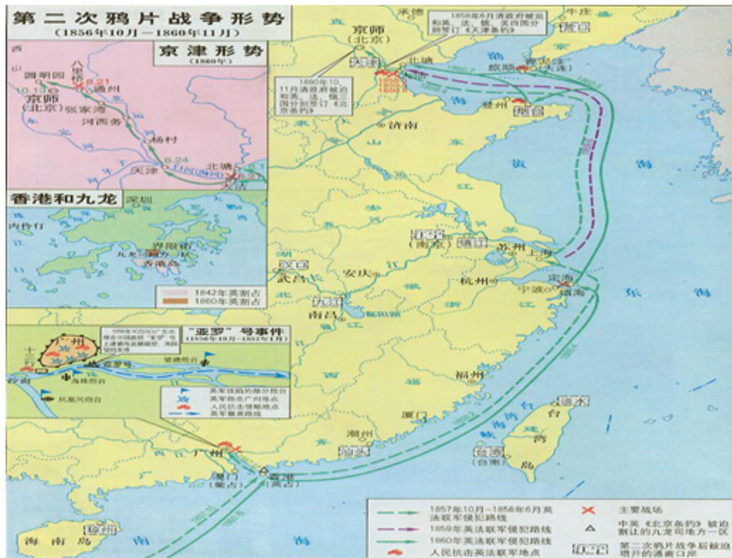
图 2 第二次鸦片战争形势图

(La foto es la situación de la Segunda Guerra del Opio, es un mapa de China, pero es incompleto, solo los puertos que obligan a abrir, son tantos, y hay unas rutas de los británicos. La mayoría es el ejército marino.)