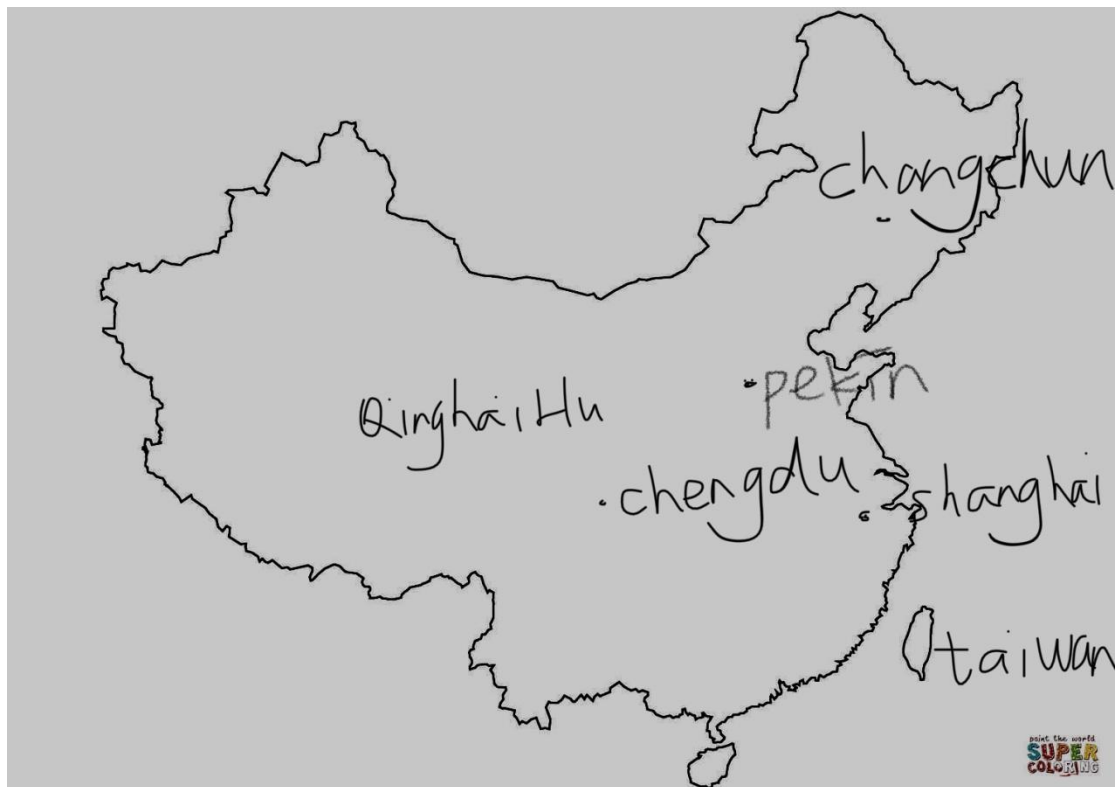
Mapa del área de Xikang: