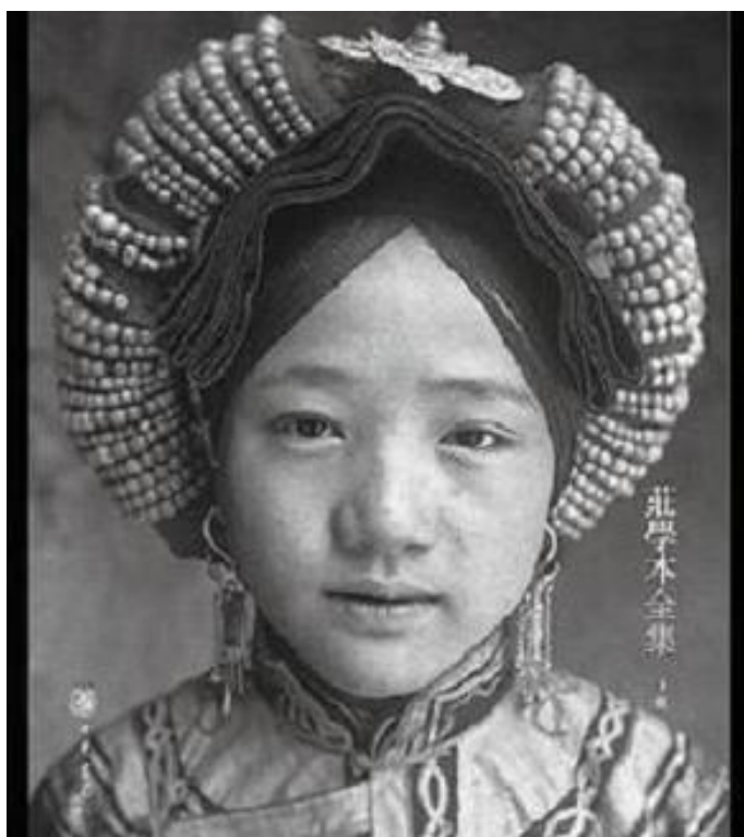
Personas de etnias chinas minoritarias