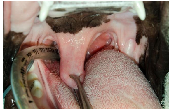
Imagen 2. Elongación del paladar blando.

Debido al flujo de aire turbulento, el trauma mecánico y el aumento de presión negativa en la inspiración, producido por las anomalías anatómicas primarias aparecen las anomalías secundarias como la eversión de los sáculos laríngeos y el colapso laríngeo que es una complicación secundaria muy frecuente. Por otro lado, aunque es menos común, podemos encontrarnos con presencia de hernia de hiato, colapso traqueal o atrapamiento epiglótico. 9