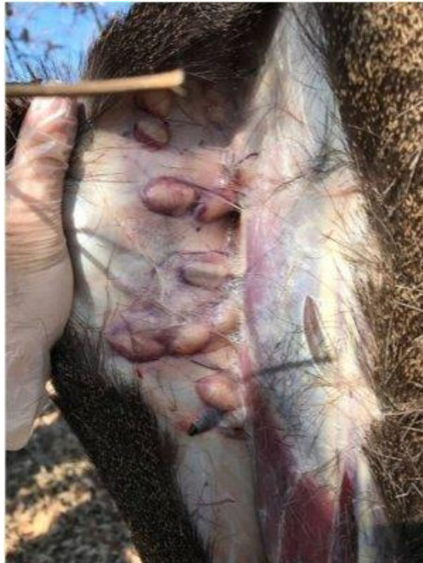
Figura 3: Presencia de barros, con larvas III en su interior, bajo la piel de un corzo

Patogenia: Al igual que el resto de moscas del género Hypoderma , las larvas forman orificios en la piel del animal, esta responde formando una serie de nódulos subcutáneos que rodean a cada larva o a un grupo de ellas; estas formaciones se denominan “barros” (Ceballos, 2007) (Figura 3). Zumpt (1965) observó que dos renos muertos tenían un material gelatinoso de color rojo en el espacio epidural y diagnosticándose que ambos animales murieron a consecuencia del daño provocado en el sistema nervioso central por la migración errática de las larvas de H. diana , aunque esto sólo es en casos aislados ya que no hay estudios sobre los efectos patológicos de esta especie de mosca (Salaba et al., 2013). Los hospedadores con Hypoderma son mucho más susceptibles a infecciones virales, bacterianas o parasitarias, debido a las enzimas inmunosupresoras que liberan las larvas durante su migración (Hendrickx et al, 1993; Pérez et al., 1995). A lo anterior, se suma la peor condición corporal de los hospedadores y que las partes que presenten nódulos deberán ser decomisadas y por tanto, disminuye la producción. En el caso de H. diana , si llega a la médula espinal puede provocar parálisis en las extremidades posteriores. Sobre H. actaeon no se tienen datos acerca de sus efectos patológicos. (Zumpt, 1965).