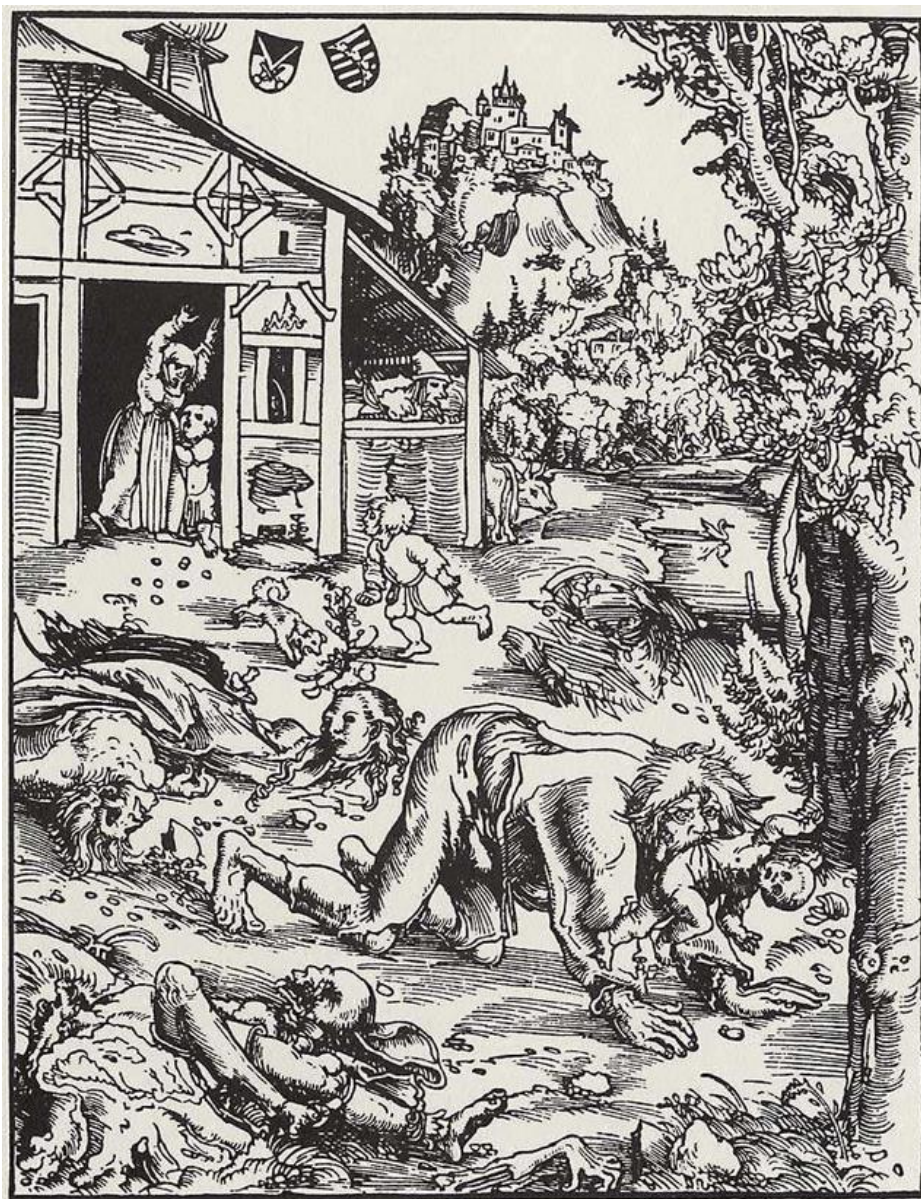
Ilustración 1. Xilografía de un ataque de un hombre-lobo, 1512. Lucas Cranach el Viejo.