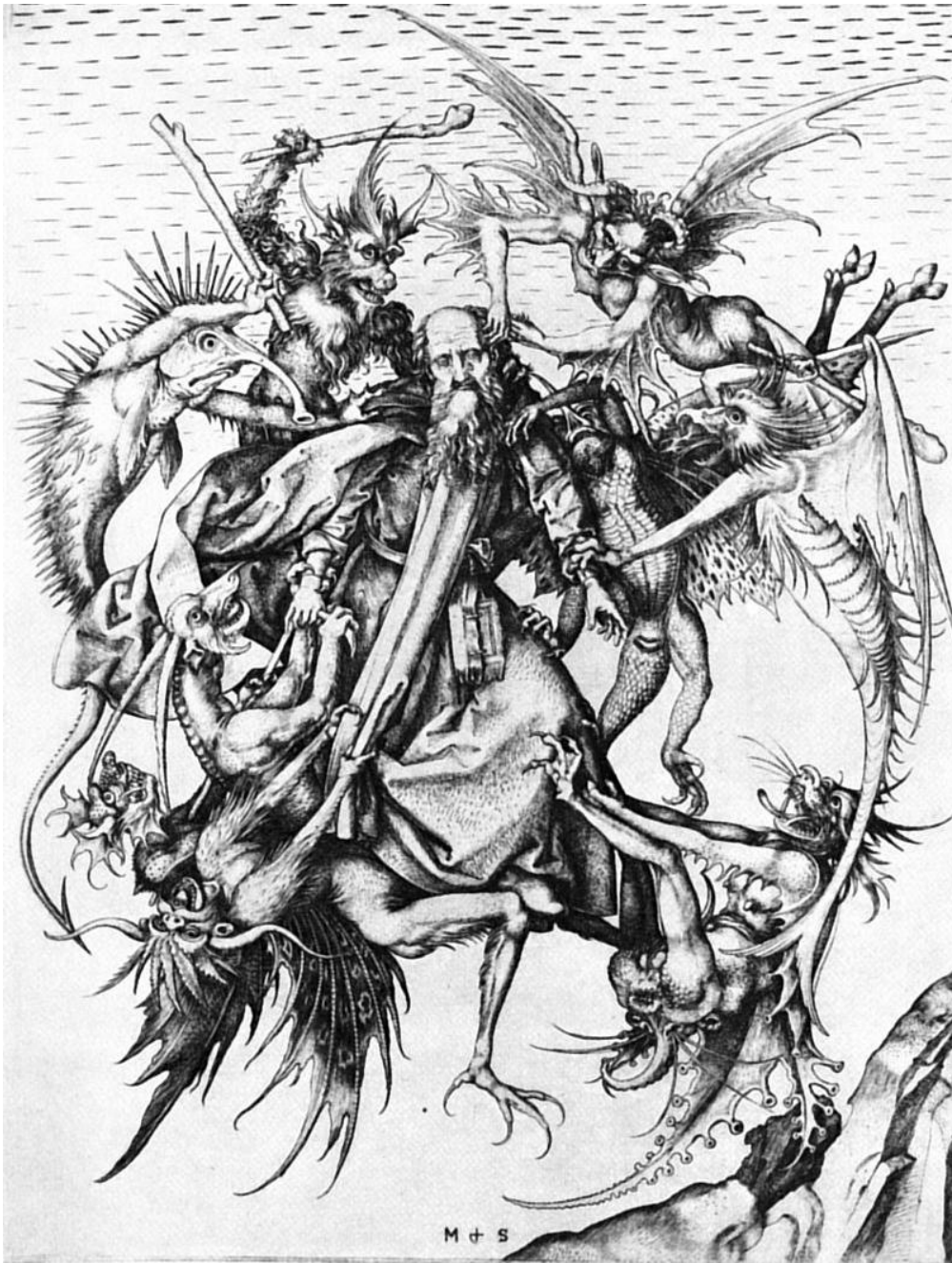
Ilustración 5. Las tentaciones de San Antonio, 1470. Grabado de M. Schongauer. Museo Metropolitano de Arte, Nueva York.