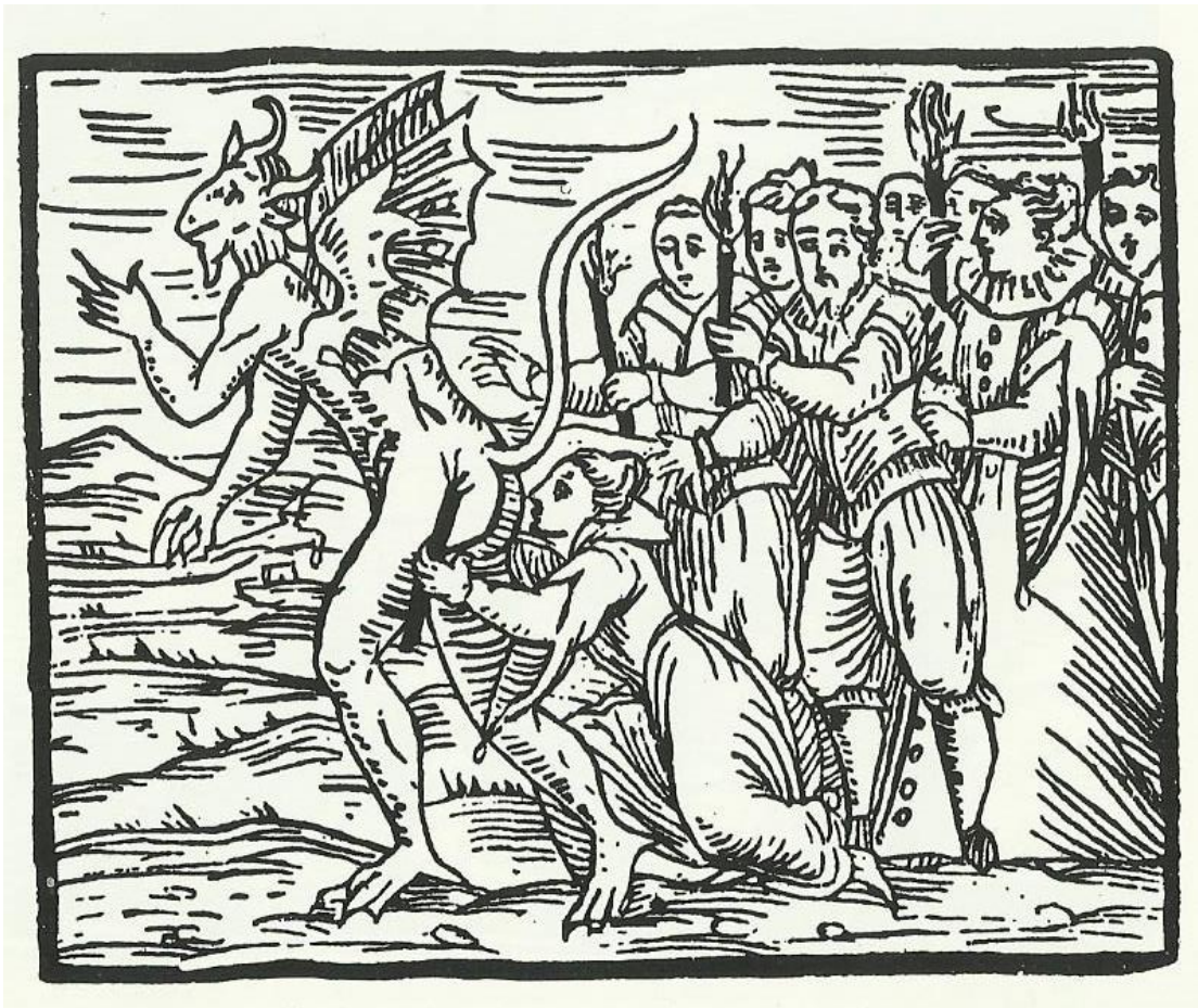
Ilustración 6. Brujos y brujas dando el beso ritual a Satán, 1610. Grabado de De Guazzo.