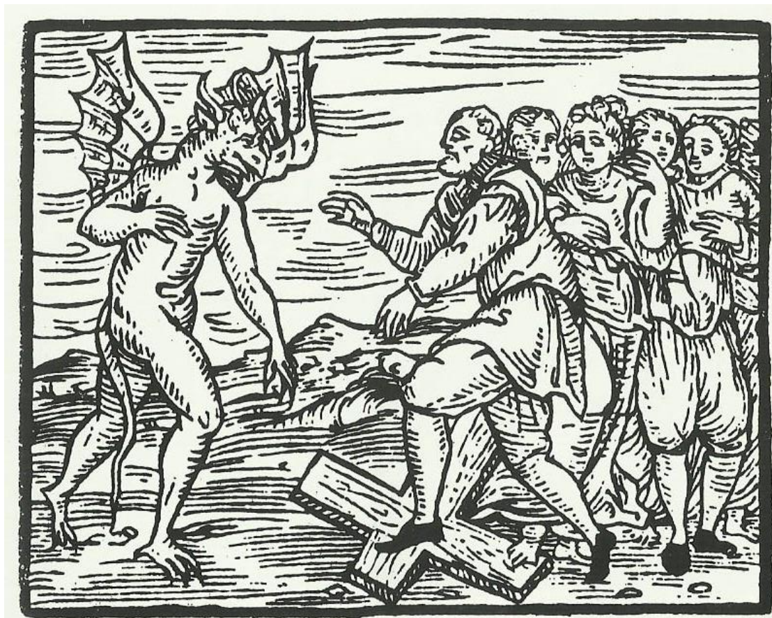
Ilustración 7. Brujas pisoteando una cruz por orden del diablo. 1610. Grabado de De Guazzo. Extraído de B.P. Levack, La Caza de Brujas en la Europa Moderna. Símbolo de apostasía.