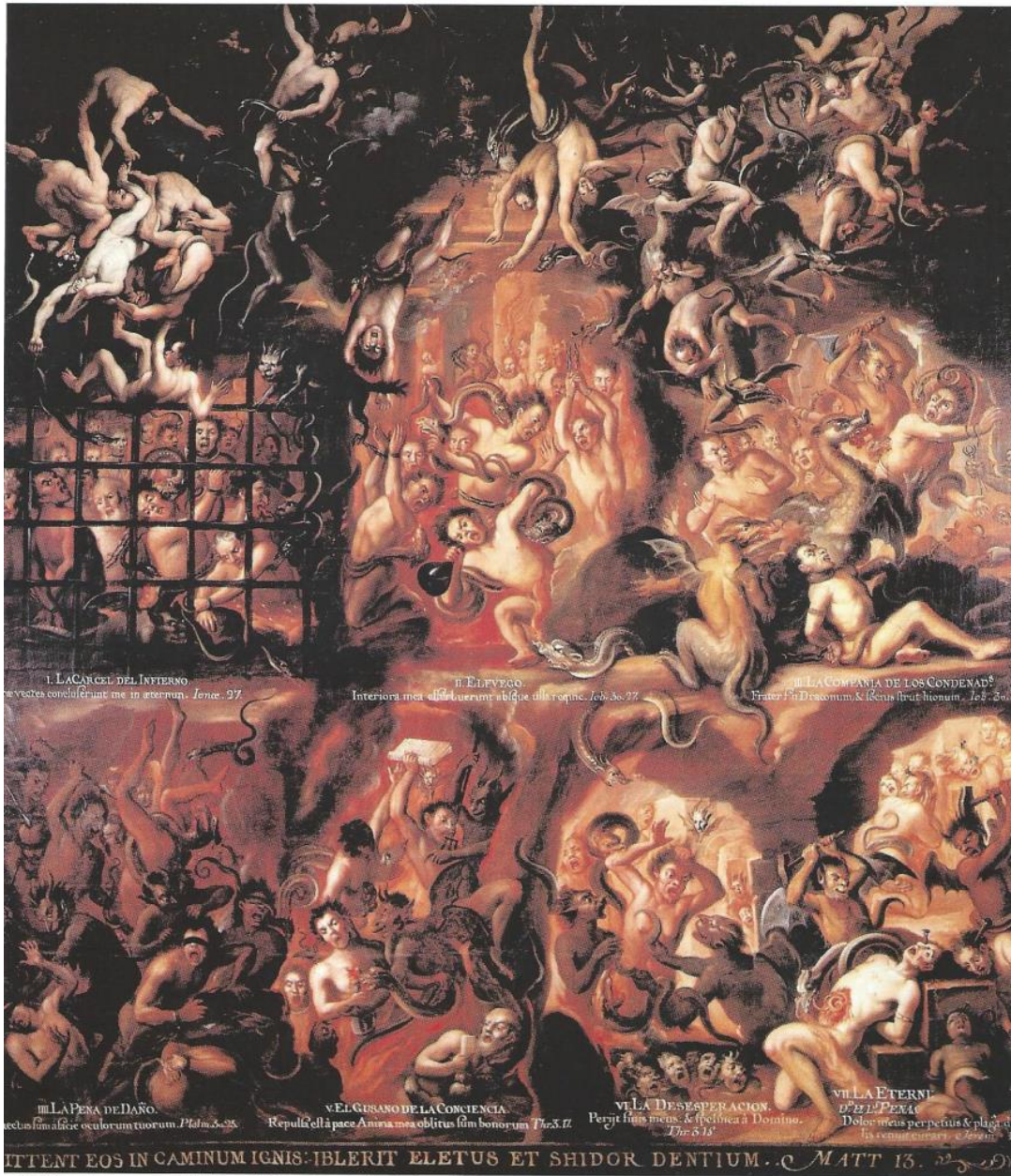
Ilustración 3. El Infierno. Miguel Cabrera (atrib.). Pinacoteca de la Profesa, Ciudad de México.