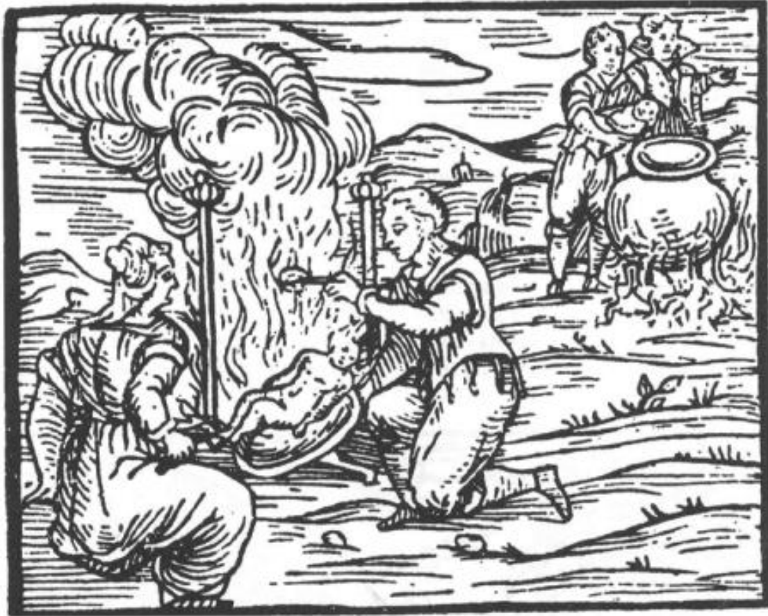
Ilustración 8. Brujas cocinando niños, 1610. Grabado de De Guazzo. Extraído de B.P. Levack, La Caza de Brujas en la Europa Moderna.