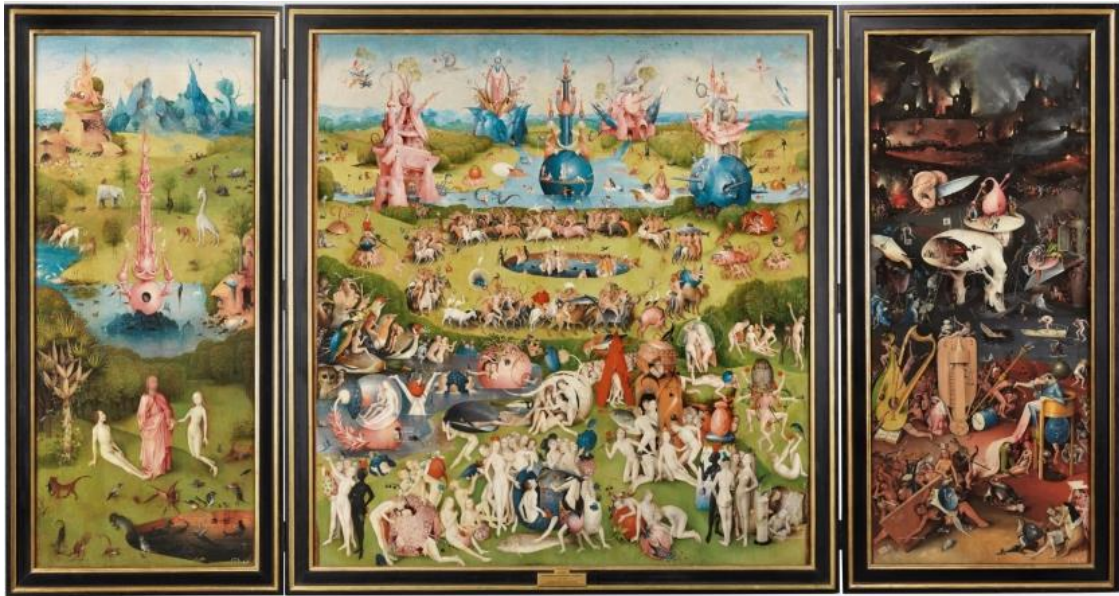
Ilustración 2. Tríptico del Jardín de las Delicias, 1490-1500. El Bosco. En la tercera parte, el Infierno. Museo del Prado, Madrid.