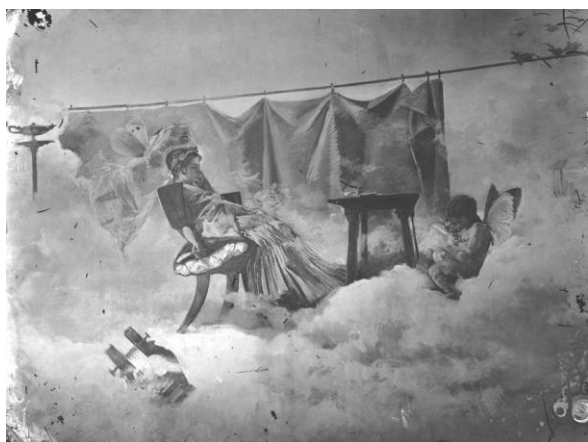
Figura 4. La alegoría del Café . Lienzo pintado por Emilio Sala para el techo del café de Fornos de Madrid, fotografía por J. Laurent y Cía. Fuente: Ruiz Vernacci (Instituto del Patrimonio Cultural de España, Ministerio de Educación, Cultura y Deporte).