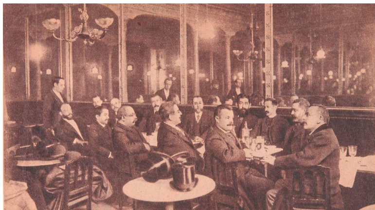
Fig. 6. Tertulia literaria en el café de Fornos , Madrid.

dros y, en concreto, de artistas como Jaime Morera, Eliseo Meifrén y José Lupiáñez (Romano, 1928: 17).