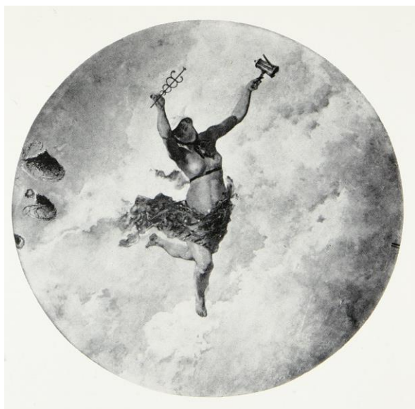
Fig. 3. Figura de Mercurio para la decoración del café de Fornos , por Emilio Sala Francés, 1879.

tado, o más bien acurrucado en la nube que forman los vapores que se elevan de la tierra al amanecer un travieso geniecillo o putti le vierte café en el tintero, mientras que otro, envuelto en tules y con alas de pensamiento, viene a traerle esa inspiración que se siente en las primeras horas de la mañana, después de haber pasado la noche en vela. La lámpara que había ardido toda la noche se apaga a la primera claridad del alba. Al mismo tiempo, sobre el barrote que sostiene una cortina, viene a posarse un grupo de pájaros, cuyo plumaje está aún húmedo por el rocío de la madrugada ( La Unión , 1879: 1-2).