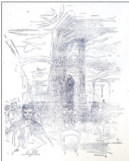
Figura 5. Aspecto parcial del interior del café de Fornos , 1884.

La prensa madrileña reseñaba que este establecimiento, tras esta transformación acometida con arte y elegancia, resultaba superior a otros de su clase en el extranjero. También se decía de él que era “un museo con las reputadas firmas de Sala, Vallejo, Gomar, Araujo, Perea, Guerrero y de otros artistas que compitieron en dar a los adornos un sello de buen gusto que armonizaba las diversas artes” ( La Ilustración Española y Americana , 1879: 242).