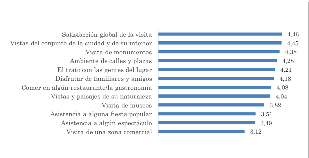
Figura 1: Satisfacción con las actividades, rutas y manifestaciones de ocio y recreación que facilitan las ciudades monumentales

El componente afectivo o emotividad se experimenta en el lugar visitado, que son ciudades monumentales o lugares históricos, que dan cuenta de la satisfacción global que se obtiene de las prácticas turísticas. En la Figura 1 se aprecia que, en general, las prácticas del turista están bastante delimitadas por la contemplación del paisaje cultural y la satisfacción que experimenta en la visita y duración de la misma, en la que las visitas y las vistas de las ciudades históricas y sus paisajes culturales son las que acaparan las posibilidades que se ofertan, para después aglutinar las prácticas relacionadas con visita de monumentos, ambiente de calles y plazas, trato con las gentes, disfrutar de familiares, la gastronomía, disfrute de paisajes de naturaleza, museos, fiestas populares, espectáculos y zona comercial.