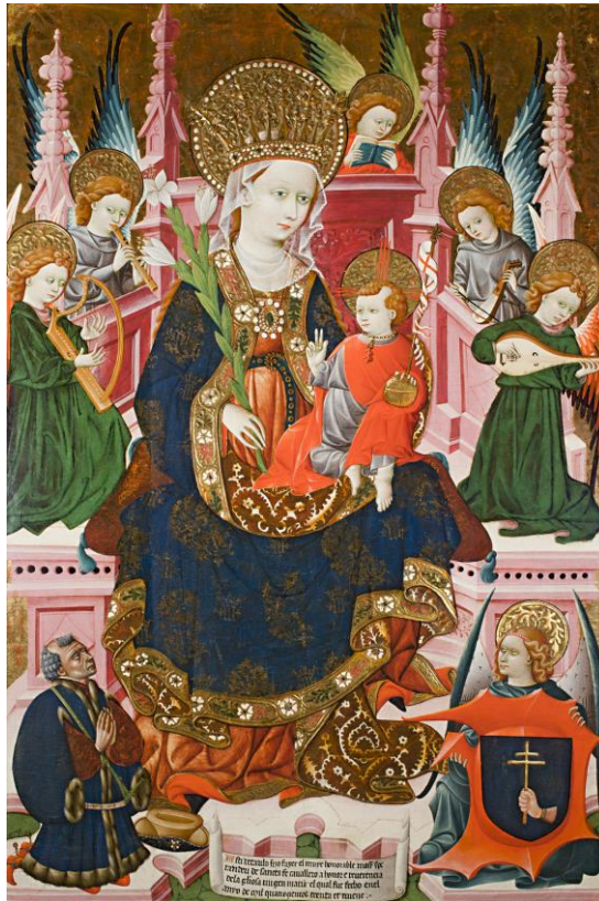
Retablo dedicado a la Virgen procedente de la capilla de Esperandeu de Santa Fe. Museo Lázaro-Galdiano, Madrid (nº de inventario: 2.857; dimensiones: 167 x 107 cm).