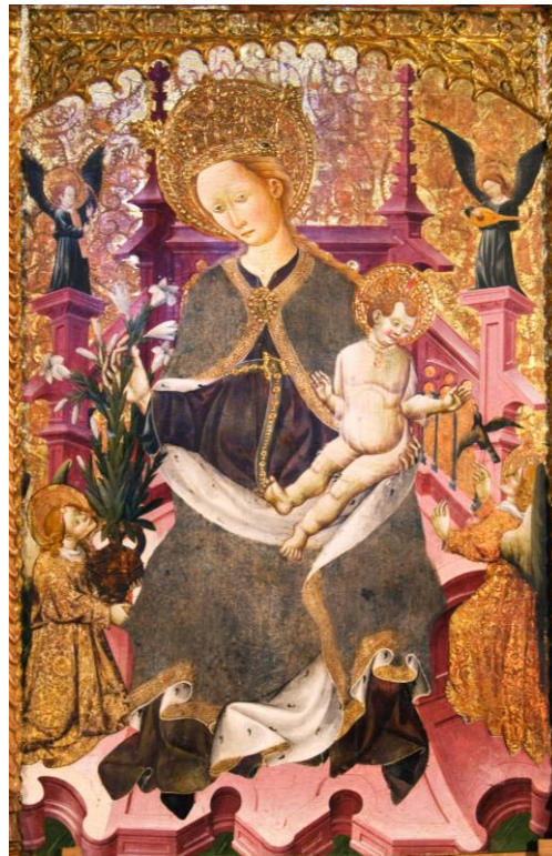
Imagen 15. María, reina de los cielos . Retablo mayor de la iglesia parroquial de Santa María la Mayor de Tosos (Zaragoza).