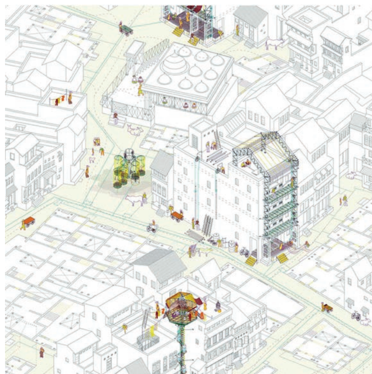
Almudena Cano, “Estrategias de regeneración en los pols de Ahmedabad,” proyecto final de Carrera, 2012. Fuente: http://arenasbasabepalacios.com/blog/2012/05/15/estrategias-de-regeneracion-de-los-pols-ahmedabad/ . Fecha de consulta: octubre de 2017