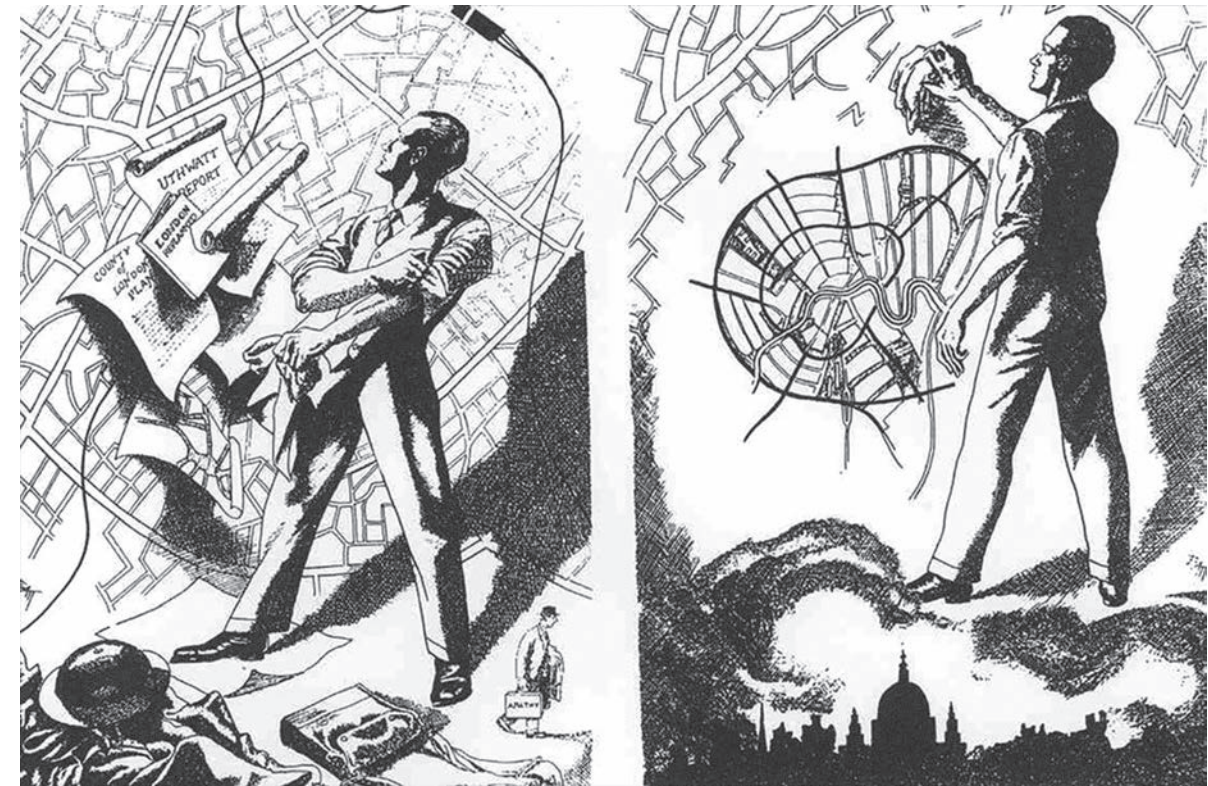
Viñeta de C. Burdon. Fuente: Leonardo Benévolo, Historia de la arquitectura moderna