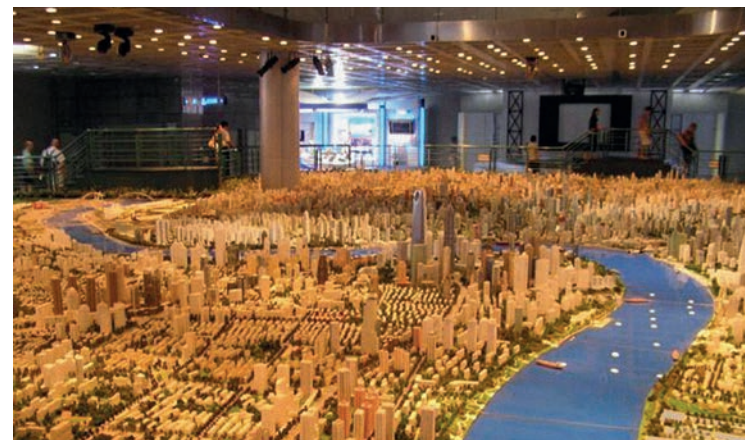
Maqueta de Shanghai, 2008

6 Reconozca, le guste o no, que la tecnología digital ha llegado para quedarse y renuncie a la fetichista obsesión por las maquetas. Si es necesario utilizarlas en los primeros cursos como medio para que los alumnos adquieran el manejo de la escala, utilícelas únicamente como herramienta de trabajo. Jamás como presentación final. Enséñeles en cambio un empleo adecuado de las herramientas digitales de modelado basadas en la sinceridad y la investigación. De poco sirve enseñar a los alumnos desde las escuelas de arquitectura a trucar los renders y los fotomontajes para que ganen concursos que no van a ser capaces de construir. Ahórreles 30 o 50 horas de trabajo en la construcción de maquetas destinadas a salir en las fotos de promoción de las ofertas académicas y dedique ese tiempo a enseñarles distintas teorías de proyecto.