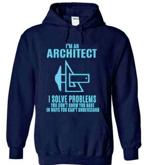
Sudadera “I’m an architect. I solve problems you don’t know you have in ways you can’t understand.” Fuente: http://www.careerstshirts.com/2016/06/im-solution-architect-i-solve-problems.html . Fecha de consulta: octubre de 2017

Arquitecto, ingeniero industrial, ingeniero mecánico Profesor del Área de Ingeniería de la Construcción. Departamento de Ingeniería Mecánica. Escuela de Ingeniería y Arquitectura. Universidad de Zaragoza, España ✉ ecs@unizar.es